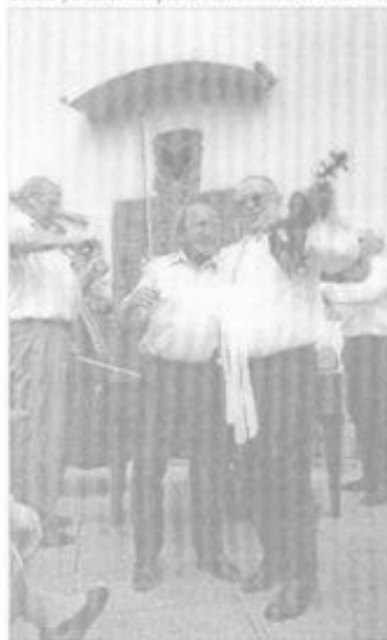
Primál a blatnický tenor v plném nasazení