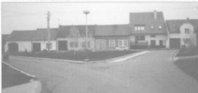
Park v horní části Řádku