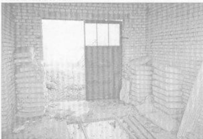
Škoda, že pan Koňárek netuší, mohl mlet cement celou zimu.