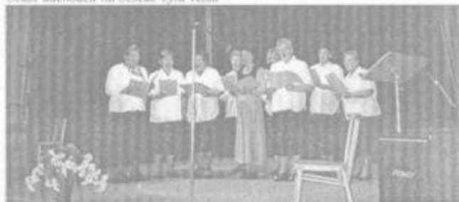
Blatnický ženský pěvecký sbor v akci - NABUCCO lepli jak v Národním divadle