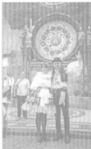
Už nám odbíjejí poslední minuty svobody.