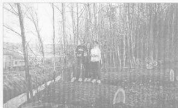
Při čístění Sírání nám pomáhali i školáci – kdo je pozná?