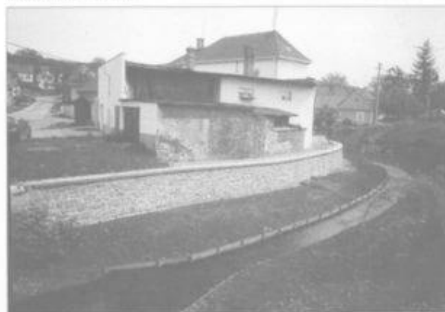
Opěrná zeď pod Društvozem

byla provedena i rekonstrukce studánky. V průběhu roku byla zahájena rekonstrukce chodníků v Dědině a Nádražní ulici.