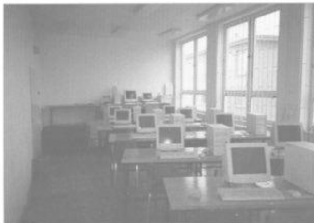
Počítačová učebna v základní škole.