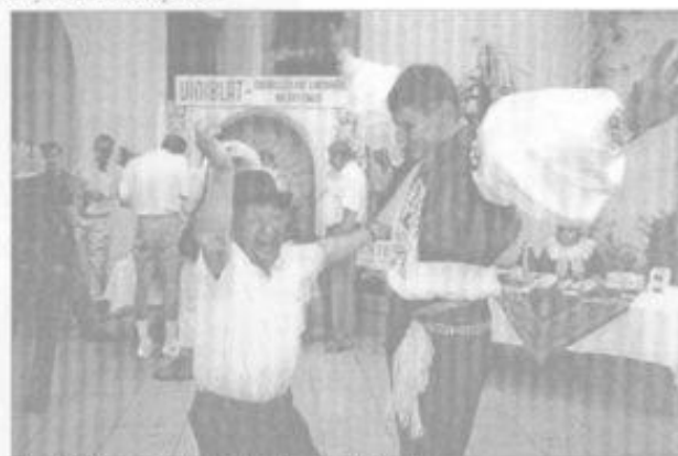
Blatnický tenor se svou ochrankou v plném rejži