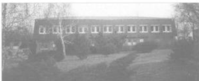
Zastřešení tělocvičny základní školy

V návaznosti na novou uličku Řádek Staré Hory byla provedena rekonstrukce komunikace pod Starým Horama včetně vybudování parkoviště, osazení obrubníků, nalezení šachet na kanalizaci, které naši předkové zasypali a pokryli asfaltovým koberecem a byly vybudovány čtyři kanalizační vpusti. V trati Rybníčky byla zahájena rekonstrukce starého kvelbeného mostu, při jehož rekonstrukci