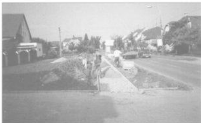
Budování parku a chodníku za pekárnou