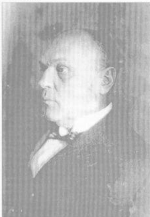
Švehla v mladých letech.