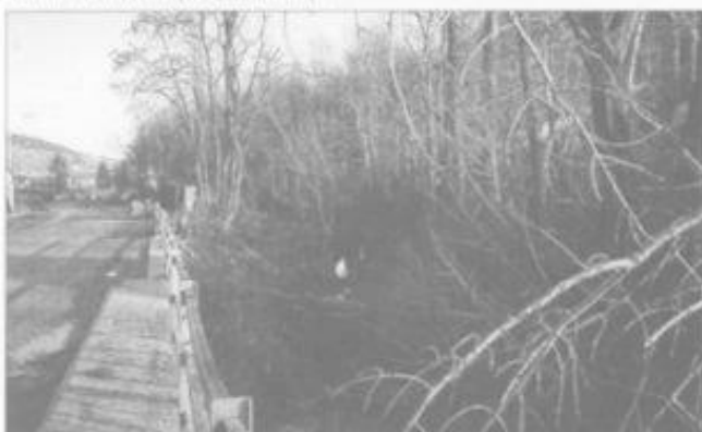
Likvidace nebezpečných topolů na Stráni