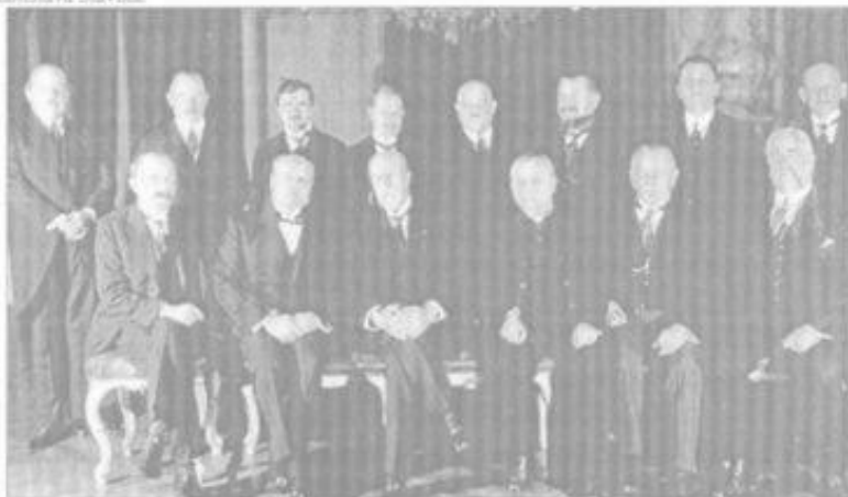
Švehla s T. G. Masarykem v době, kdy byl předsedou vlády.