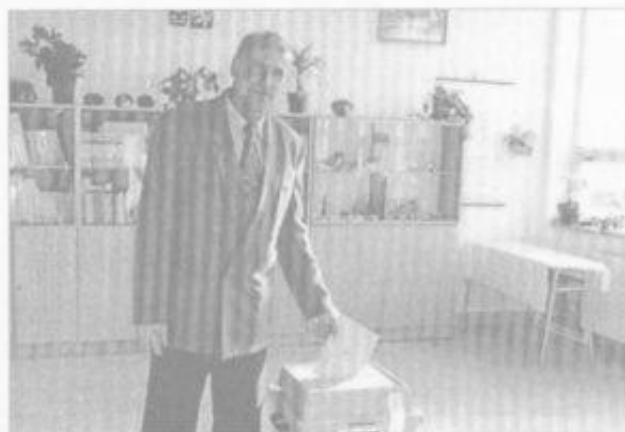
Zástupce starosty u volební urny.