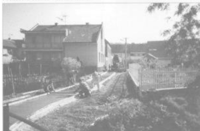
Ulička Rádek - Dědina