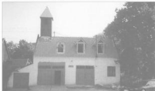
Požární zbrojnice při rekonstrukci střechy.