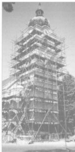
Rekonstrukce fasády kostela sv. Chuděje