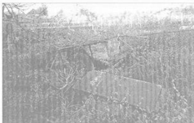
Některé poklady uložené na volném prostranství 20. let