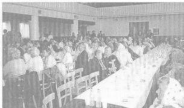
Účast důchodců na besedě byla velká