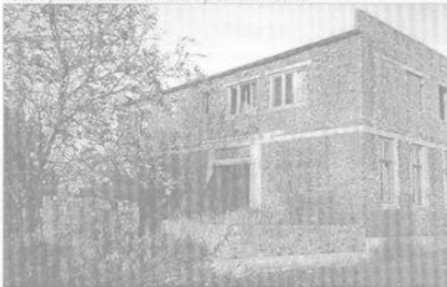
Pohled na budovu od hřiště