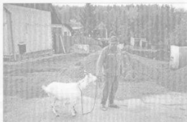
„Já už k Heléně zpátky nejdu. Mámimě ji k capovi“