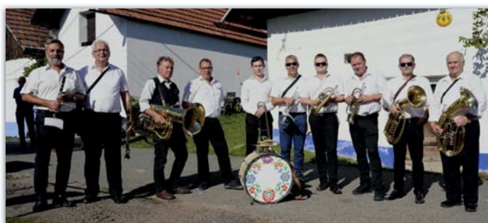
Blatnická dechovka k Blatnickému vinobraní prostě patří