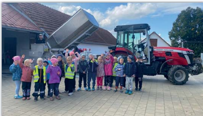
Exkurze u vinaře