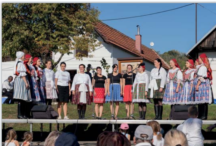
Na vinobraní si stříhly své první vystoupení i maminky dětí z Vavříнку