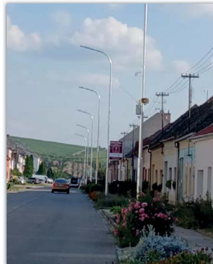
Při silnicích na Louku a na Blatničku byly vyměněny sloupy veřejného osvětlení