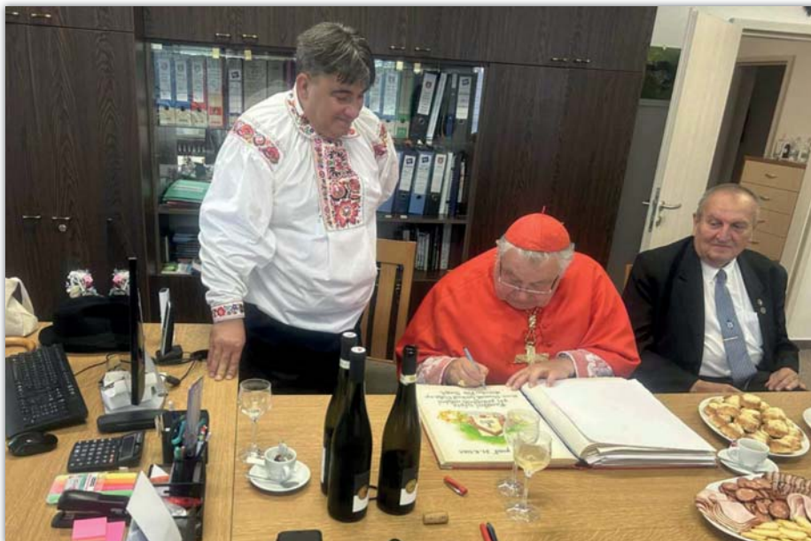
Vzácná návštěva mons. Dominika kardinála Duky u nás na radnici