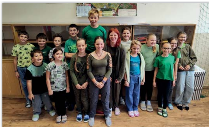
Barevný den zdraví na 1. stupni

Závěr kalendářního roku náleží tradičním vánočním aktivitám. Čtvrtého prosince se děti radovaly z mikulášské nadílky. Na předvánoční atmosféru nás vždycky naladí vystoupení ZUŠ ve Veselí nad Moravou. A poslední školní den před Vánoce patří třídní besídce, dárčkům a slavnostní náladě.