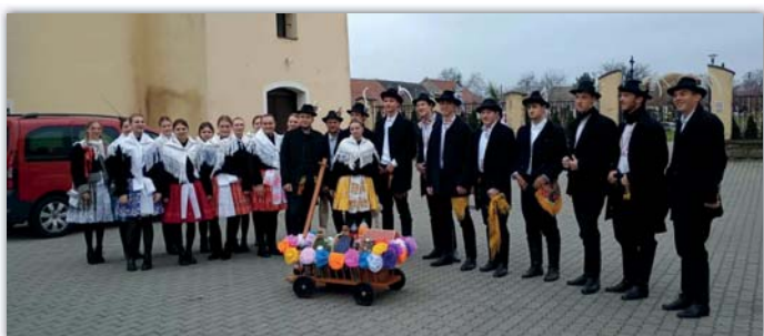
Jde se na to – obejít dědinu, pozvat každého a snad aj něco vybrat do pytlá.