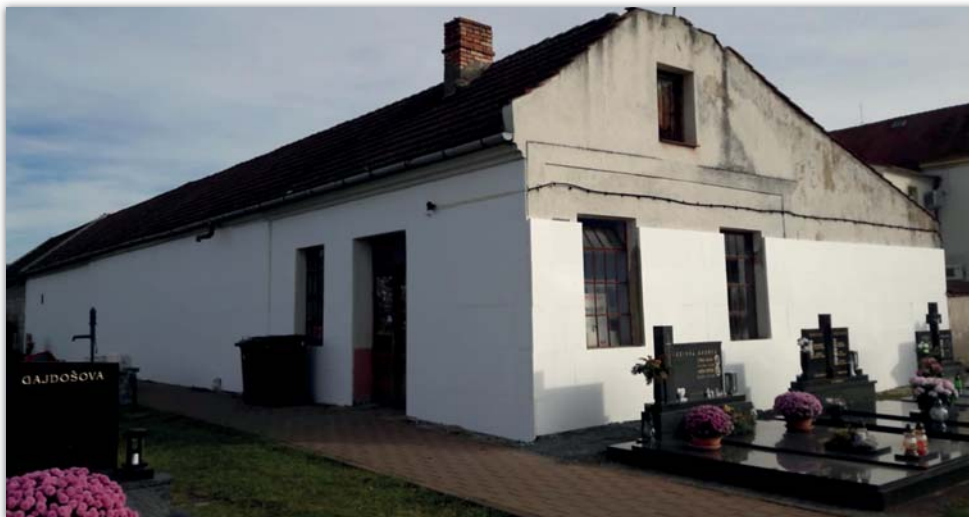
Márnice a přilehlé budovy na hřbitově dostaly novou fasádu – foto v průběhu rekonstrukce