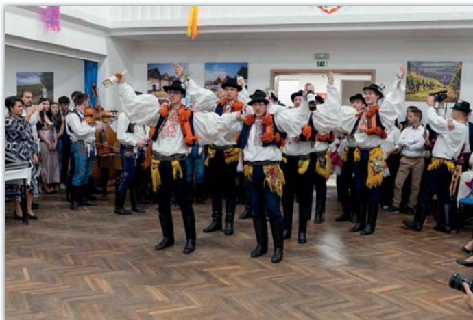
Očekávané vystoupení začíná