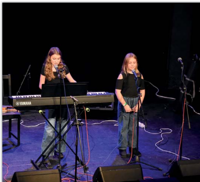
Finále festivalu Brána 2025