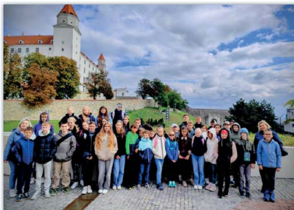
Žáci druhého stupně v Bratislavě

mi. Výstava v chodbách připomněla rozmanitost kultur a důležitost cizích jazyků. Říjen jsme zahájili návštěvou Bratislavy, kde jsme nejdříve navštívili hrad Děvín a historické centrum Bratislavy s Katedrálou sv. Martina a sochou Čumila. Prošli jsme Bratislavským hradem a viděli Slovenské národní divadlo. Další říjnovou aktivitou byla přehlídka středních škol v Kulturním domě ve Veselí nad Moravou, kterou navštívili žáci deváté třídy.