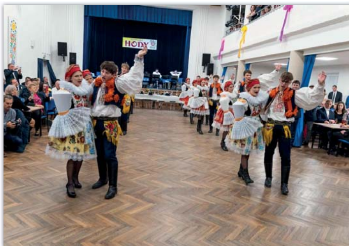
Vystoupení chasy sklidilo zasloužený potlesk