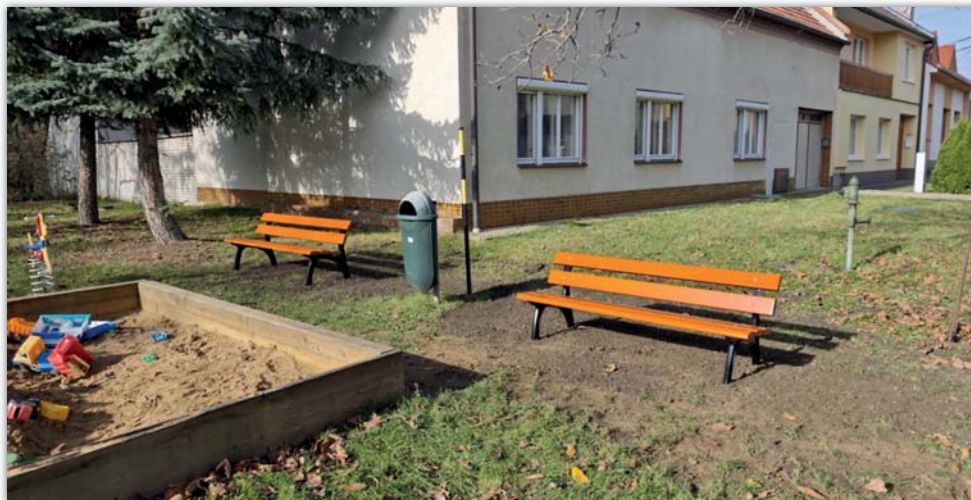
Maminky jistě ocení nové lavičky na dětských hřištích na Řádku a Pod Floriánky