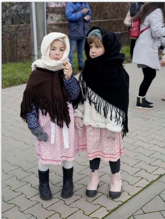
„Pod, ideme pro stárky“

konečně povolil – při tom bylo řádně přečtené hodové právo a došlo i na přípitek a sólo stárků. To vše za doprovodu místní dechovky.