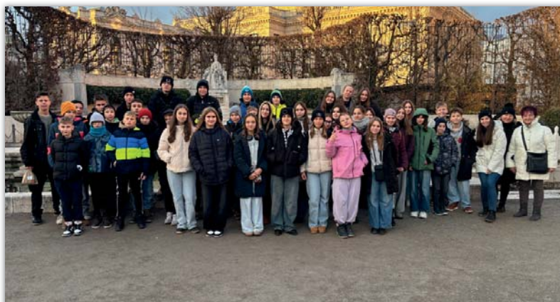
Žáci druhého stupně ve Vídni