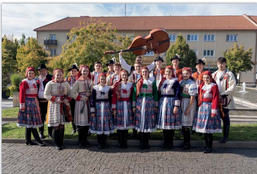
FS Svodnica s HCM Háj na Andělských hodech ve Veselí n. Moravou