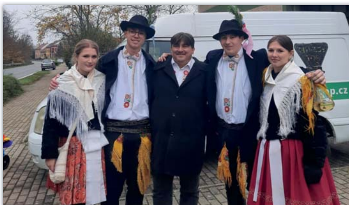
Ani na starostu sa nesmí zapomnět