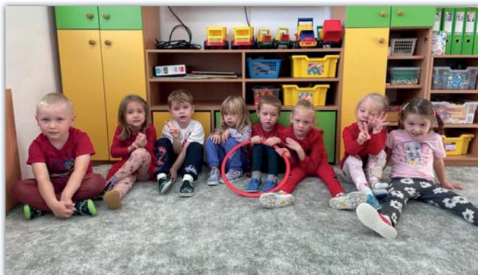
Červený den u Motýlků