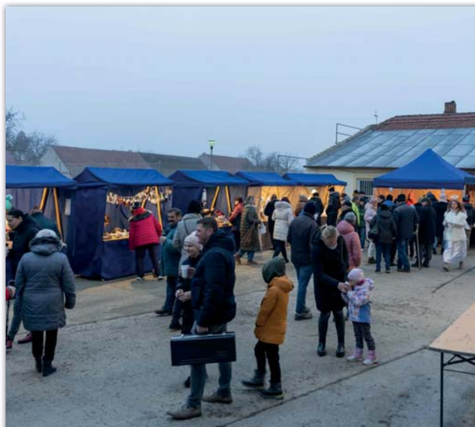
Jarmark na obecním dvoře poskytl více místa