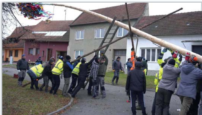
Postavit máj – to musí zažít každý chlap na dědině

Tak to je kapitola sama pro sebe – v týdnu pokáceli kluci z chasy a obecní pracovníci hlavní máj a chasa připravila menší májky u domů stárků a nazdobila „každou cedulu“ v dědině, aby všichni věděli, že sú u nás hody. V pátek od rána se chystal máj a všechno co k tomu patří – sešlo se půl dědiny, hrála dechovka a chlapi stavěli ručně májku. Nechybělo občerstvení o které se staraly děvčice z chasy. Po dobře odvedené práci se pak všechno zapilo v hospodě, kde byl i obecní gulášek. A večer se pokračovalo na Roháči na Hodovém bigbitu.