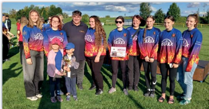
Družstvo žen skončilo na 2. místě v okrskové soutěži