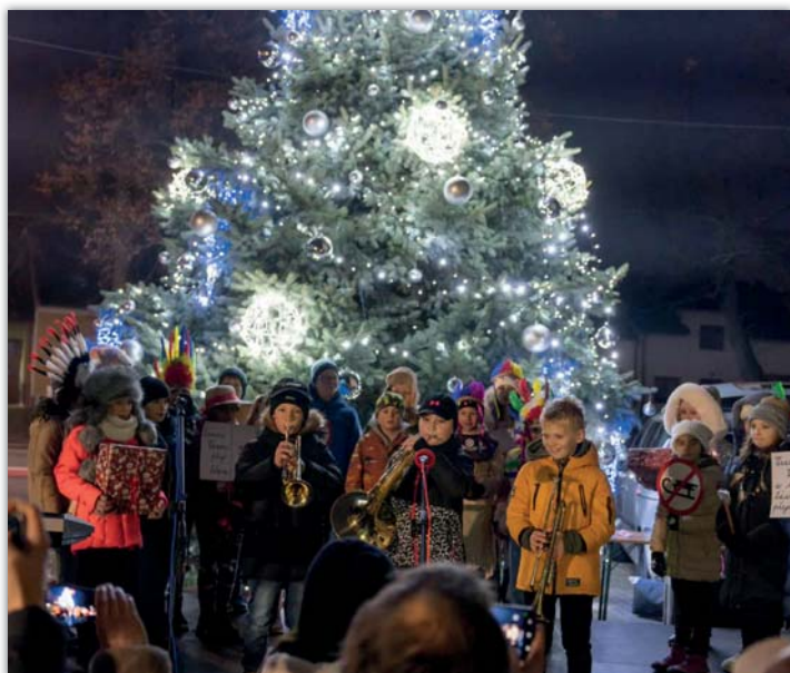
Vystoupení školáků u vánočního stromu