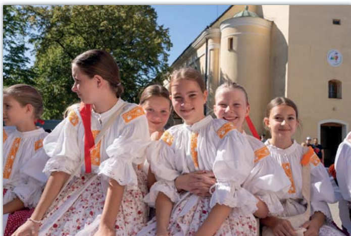
A jede se na vinobraní! Děvčátka z Vavříнку na koňském povoze