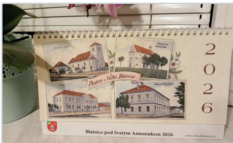
Kalendář na rok 2026

Za zmínku určitě stojí hned první lednová fotografie. Dost možná se jedná o jednu z nejstarších fotografií naší obce. Je na ní zachyceno Náměstí s kostelem a školou. A právě podle fotografie školy je možné odhadnout pořízení fotografie na přelom 19. a 20. století. Škola na snímku má totiž pouze 5 oken (dnes pošta a kanceláře obecního úřadu) a za školní budovou je patrná první přístavba – dnes obřadní síň. Školní jednopatrová budova zde byla vystavěna v letech 1832 – 1833 v místě vyhořeného obecního domu pro důstojníky. V roce 1887 byly přistavěny do dvora dvě třídy a dvě světnice pro učitele. K dalšímu rozšíření školy došlo v roce 1905, kdy byl přestavěn vnitřek školy, průčelí a obnovena střecha. A právě mezi těmito daty 1887 a 1905 byla pořízena fotografie použitá na pohlednici. V kalendáři najdete spoustu dalších zajímavých fotografií. U fotografií není popis ani datování, protože fotografie nelze přesněji datovat a na fotografiích jsou většinou notoricky známá místa. A pokud některé místo nepoznáte, můžete sledovat obecní facebookovou stránku Obec Blatnice pod Sv. Antonínkem – občas tam nějakou fotografii s popisem zveřejníme. Kalendář je možné zakoupit v kanceláři obecního úřadu a v papírnictví u paní Martinkové. Cena je 120,- Kč.