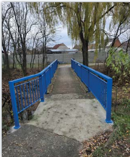
Nové zábradlí na mostku z Řádku do Dědiny