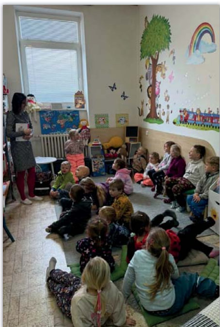
Listopadová návštěva dětí z mateřské školy