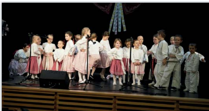
Nejmenší děti z Vavříнку