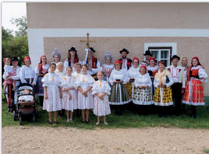
Poutní výprava do skanzenu ve Strážnici