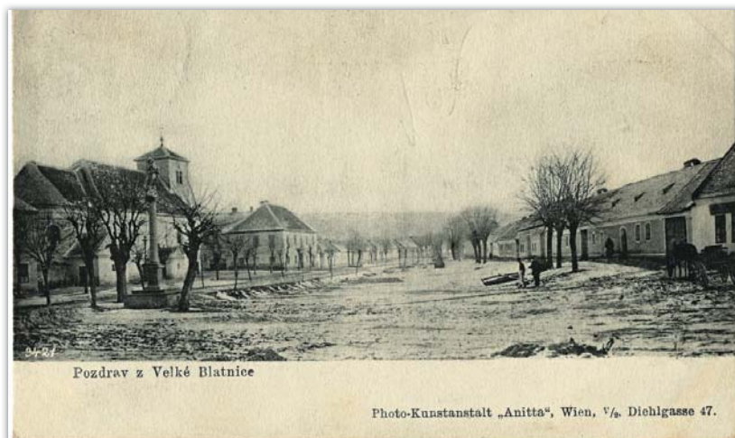
Fotografie z kalendáře dost možná pochází z konce 19. století