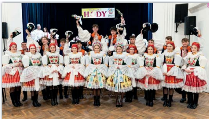
Chasu tvořilo deset krásných mladých párů

Parádní kroje, naškrobené dudovice, vyleštěné boty, klobúky do ruky a ide sa na hody! Vystoupení chasy sledoval kulturák zaplněný do posledního místečka. Za doprovodu HCM Háj ukázala chasa, co téměř dva měsíce nacvičila – a nutno říct, že dobře. Potom už večer pokračoval s dechovou hudbou Stříbrňanka, která se střídala s cimbálovou muzikou. Na své si tak přišel každý návštěvník. A když už máme hody na Kaču, tak tomu odpovídalo i počasí – přihlásila se zima se vší parádou a hodaři se nad ránem rozcházelí za vydatného sněžení.