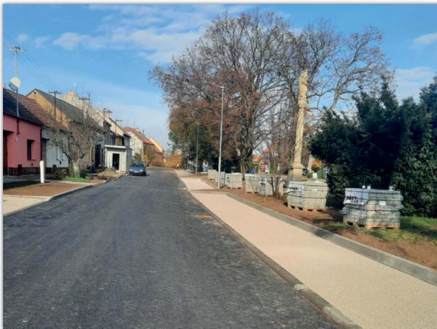
Petr Buzík Při opravené silnici vzniklo 21 nových parkovacích míst

Po dokončení silnice se začalo i s úpravou zeleně v samotném parčíku. Byly vysazeny nové stromy a záhony a na jaře se zaseje nová tráva. Úprava zeleně spadá do dotačního titulu Regenerace zeleně v obci Blatnice a postupně se bude pokračovat dále ulicí Dědina.