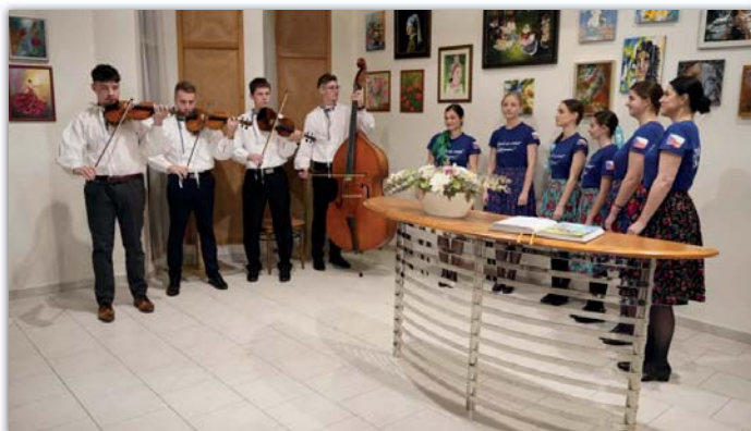
Vernisáž hodové výstavy s HCM Háj a FS Svodnica