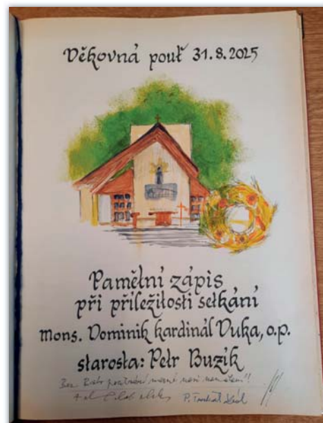
Zápis v pamětní knize obce