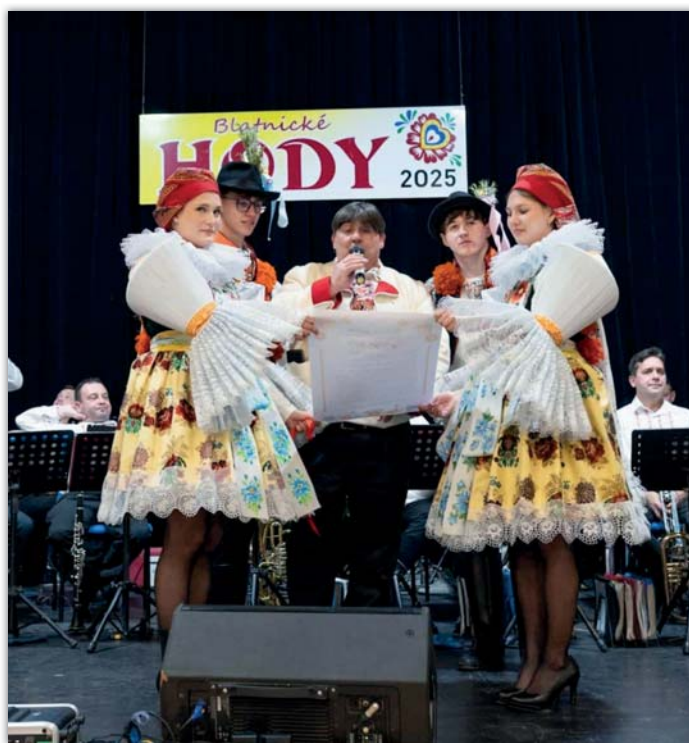
Ještě jednou pro jistotu připomenout hodové právo