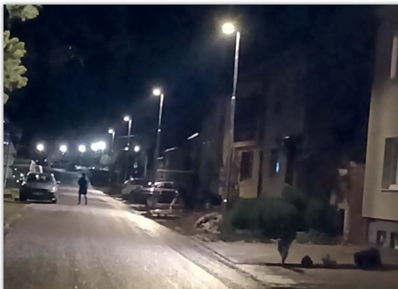
Petr Buzík Ve spodní části Řádku už svítí nové veřejné osvětlení

Koncem září začala v ulici Řádek pokládka nízkého napětí, optického kabelu a budování nového veřejného osvětlení. Podle původního plánu se měla firma MOEL dostat do konce roku k uličce Pod Staré hory. Práce na zakázce šly velmi dobře a nyní je pokládka dokončená až po uličku do Dědiny. Na tomto úseku Řádku již svítí i nové veřejné osvětlení. V průběhu prací potrápilo obyvatele Řádku počasí – při výkopových pracích vytvořil déšť na silnici blátivou břečku, čemuž se bohužel nedá úplně zabránit. Prosím tedy o toleranci a shovívavost – po dokončení jednotlivých úseků povoláme v případě nutnosti čistící vůz. Po novém roce budou práce pokračovat podle počasí a dále do Antonínkové ulice.