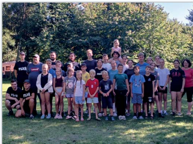
Tábor mladých hasičů na Lučině