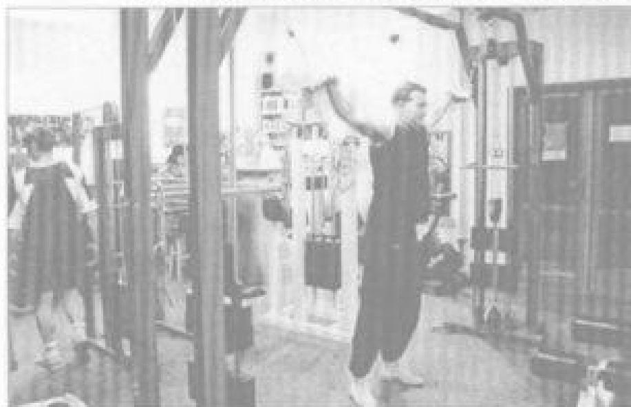
Text a foto: Lenka Fajčíková