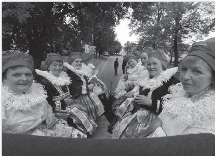
Zpěvačky jely při vinobraní na voze taženém koňským potahem.