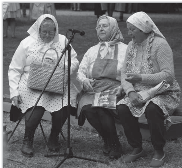
Scénka ze života žen na slovácké vesnici divákům pořádně procvičila bránice.