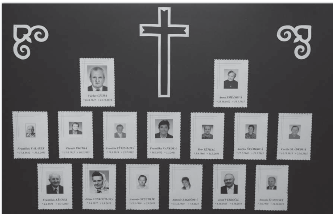
Letos nás na věčnost přešli tito spoluobčané.