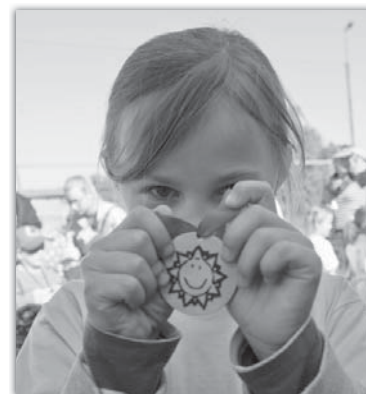
Radost ze zlaté medaile