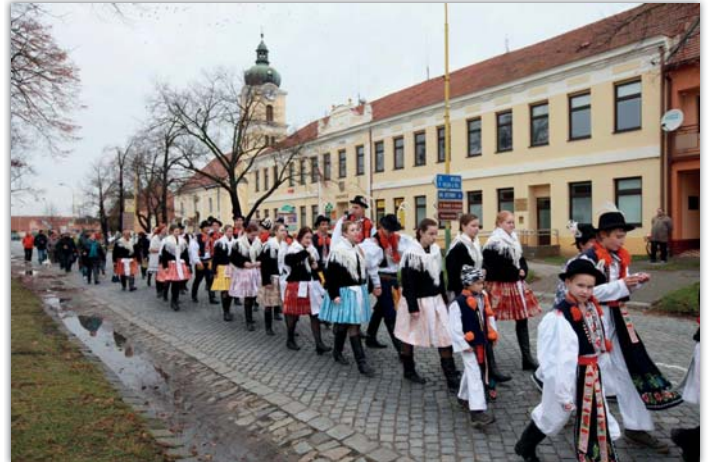
Krojovaná chasa, členové Vavříнку i civilisté se letos o hodové sobotě vydali ve 13 hodin od obecního úřadu pro stárky.