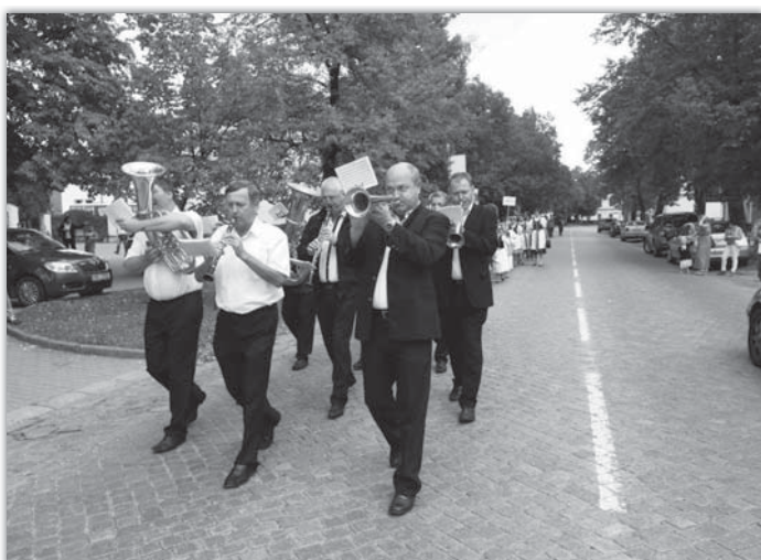
Při vinobraní nemohla chybět blatnická dechovka.