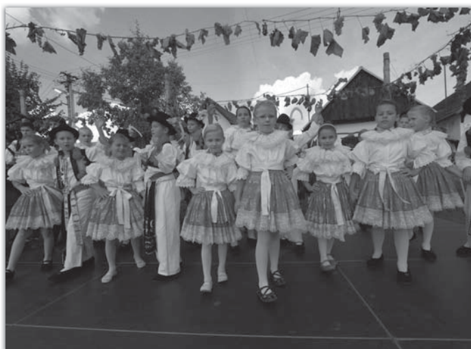
Děti z Vavříнку se předvedly v plné síle.