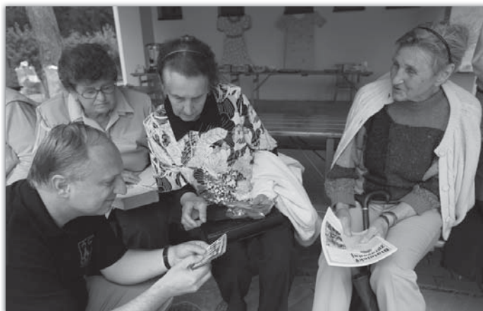
Při Antonínově létě byl program připravený pro všechny věkové kategorie.