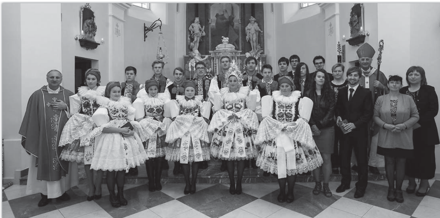
Dvaadvacet věřících přijalo v září ve farním kostele sv. Ondřeje svátost biřmování. Po roční poutivé přípravě jim ji udělil olomoucký arcibiskup Jan Graubner.