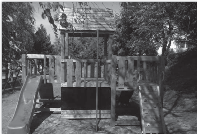
A takto vypadá stejný pohled dnes. Kromě hradu na snímku je zde i moderní kolotoč, houpačka a motorka pro nejmenší.