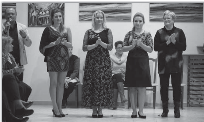
Předváděné modely byly na nejrůznější postavy.