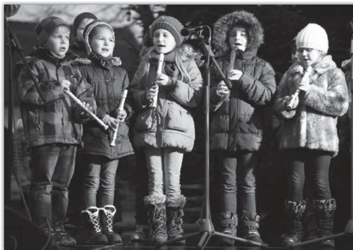
Pedagogové se svými svěřenci připravili krásný program.