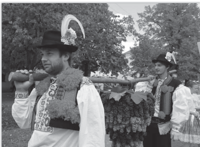
Obří hrozen vážil více než padesát kilogramů.