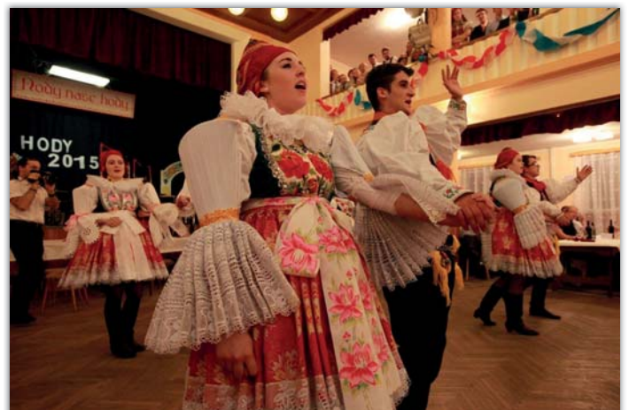
Hody vyvrcholily sobotní zábavou.