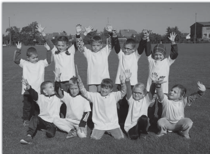
Úspěšné družstvo malých reprezentantů blatnické mateřské školy, které při štafetovém běhu Babí léto zvítězilo.