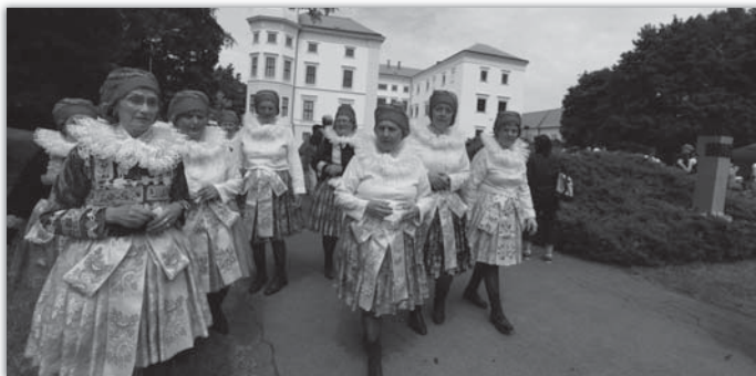
Před vystoupením měly blatnické ženy brzy ráno i čas na procházku probouzejícím se strážnickým parkem.