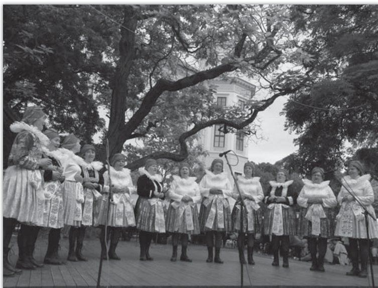
Ženy na MFF ve Strážnici vystoupily s blokem písní.