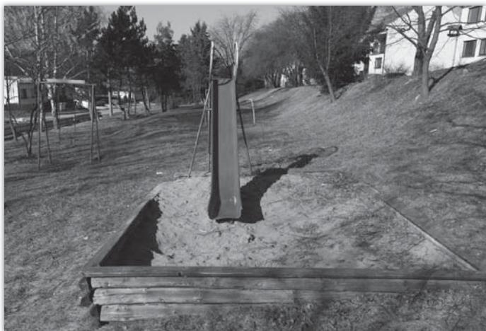
Takto vypadalo dětské hřiště Pod Floriánky ještě počátkem léta.