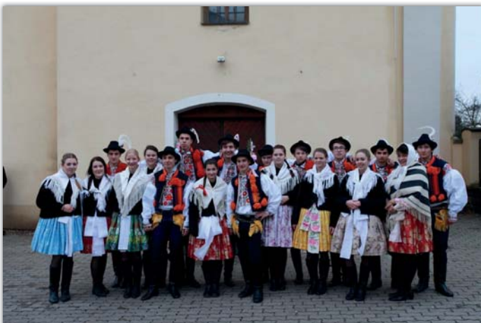
Společný snímek krojované chasy.