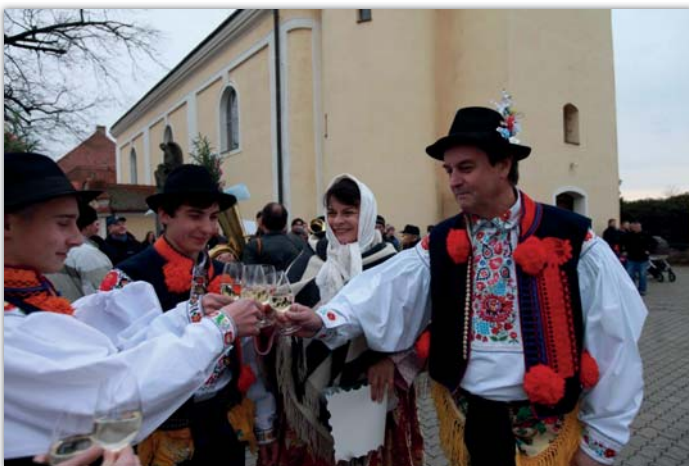
Obchůzka skončila stejně jako vloni ve tři hodiny odpoledne pod májkou mezi kostelem a obecním úřadem, kde starostka stárkům povolila pořádání letošních hodů.