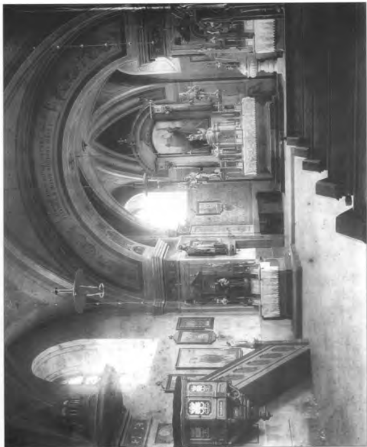
Interiér kostela sv. Ondřeje z roku 1900