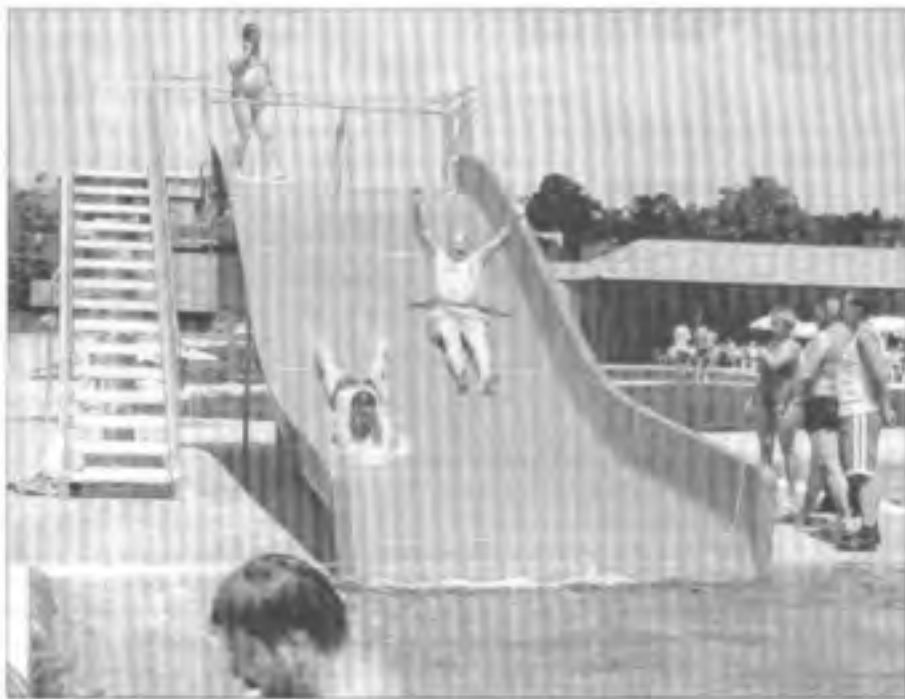
Při slavnostním otevření koupaliště v Hluku si blatnický starosta neodpustil první jízdou na vodní skluzavce.