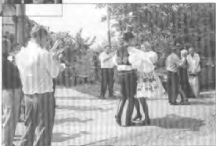
Ani nová vzbudovaná komunita nevedela ženečkám v ženečnom reji