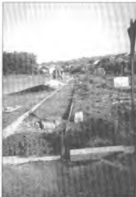
Začátek chodníku pod Jančovicým