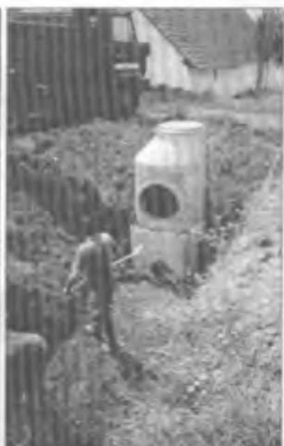
Pracovníci firmy Bachan usazují sporník přírabi přechodové lachty