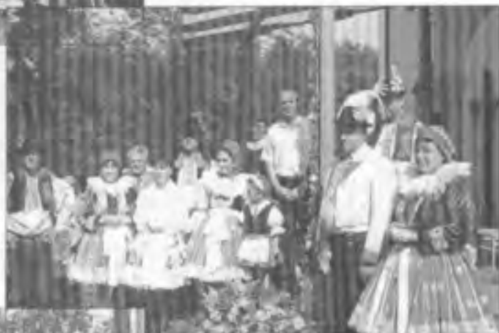
11 o Starostavé a mizantropistické mikroregiona Ostrožsko s manželkami po mál sväté.