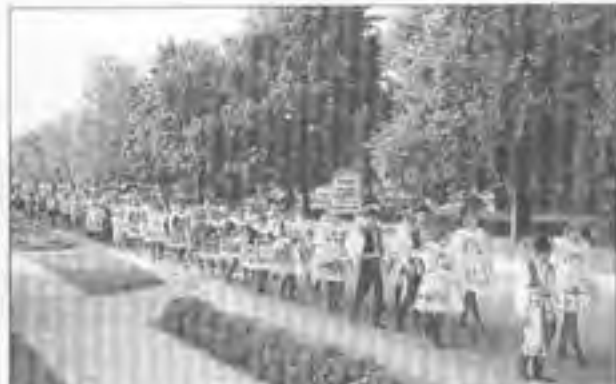
Procesí prochází Dřívím