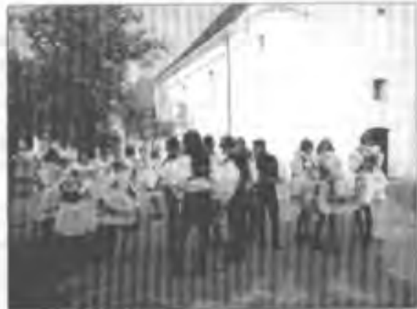
Mšeň se schází před kostelem sv. Ondřeje