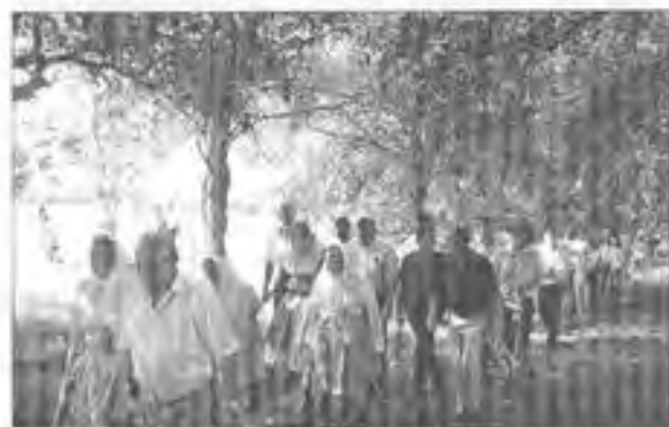
9 o Mužička ve stínu lip na cestě na kopci