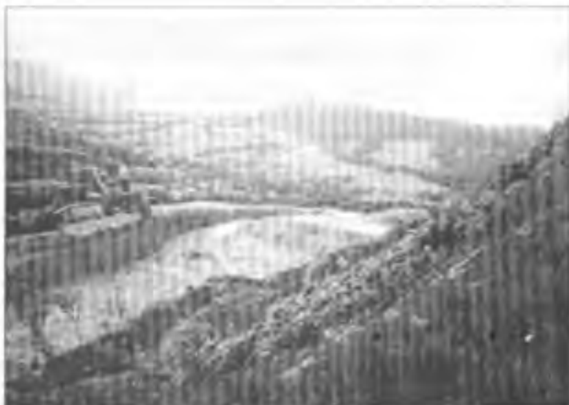
Poznávací zájezd do Štramberka, Frýdku-Místku a Provozního dne 3.8.2002 - Vápenný lom „Kotouč“ na hoře Kotouč ve Štramberku

Samotný „Lom Kotouč“ - bolestná jizva na posvátné hoře, to je hluboká strážidelná propast zkamenělého času. Gigantický sarkofág z bělostného vápence, nelehký průsečík mnoha lidských osudů i tragédií. Kolik lidských generací už tady bolestivě poznamenal na těle i na duši! Na dně té propasti se nachází rozlehlý komplex budov a zařízení vápenky a cementárny, prokáný nitkami cest a blyskavých kolejí. Jak se tu všichni odsud shora zdálo tak malé a neskočné!