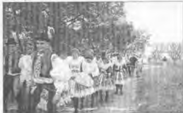
Procesí na sítné cestě na kopci