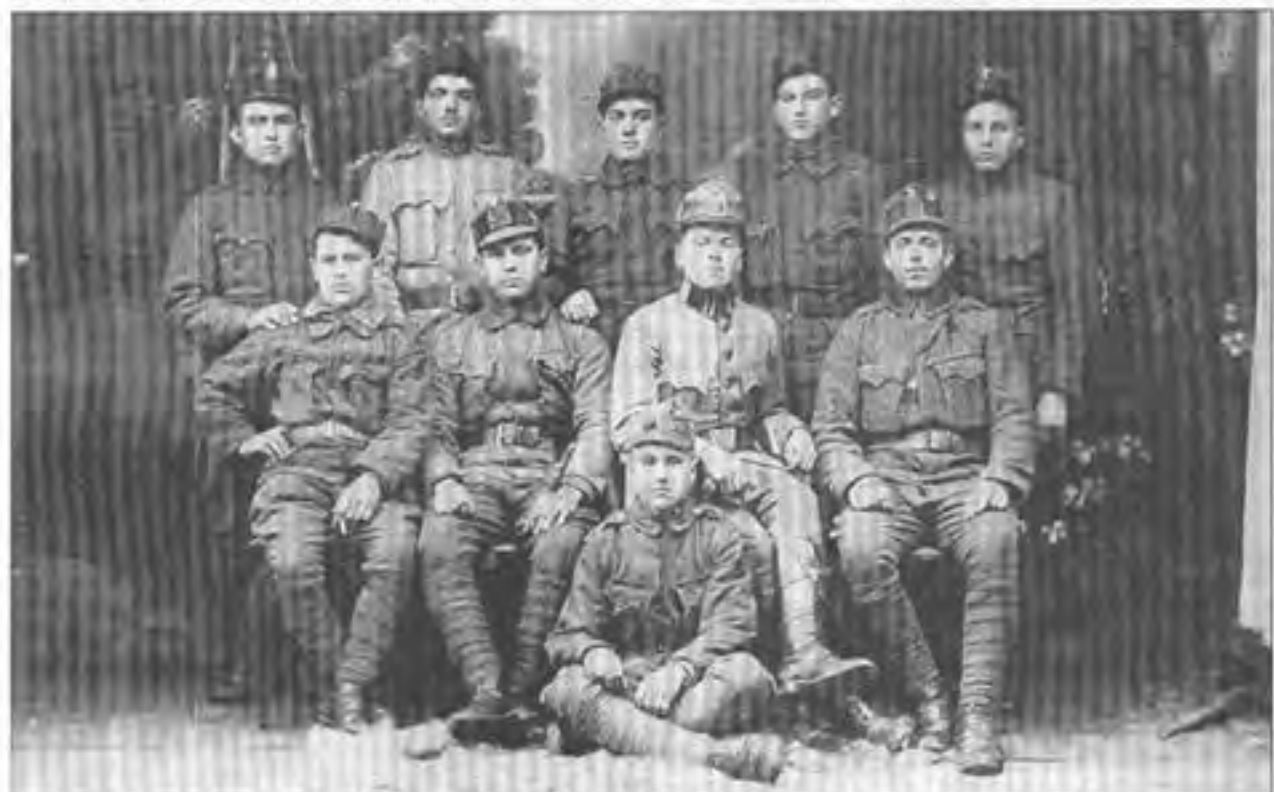
Blatničané v Rakousko-uherské armádě