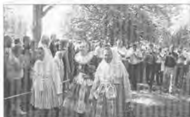
9 o Ke studánce v pohodě dorazila trojice, kterou jsme Vám představili v úvodu - u kostela sv. Ondřeje