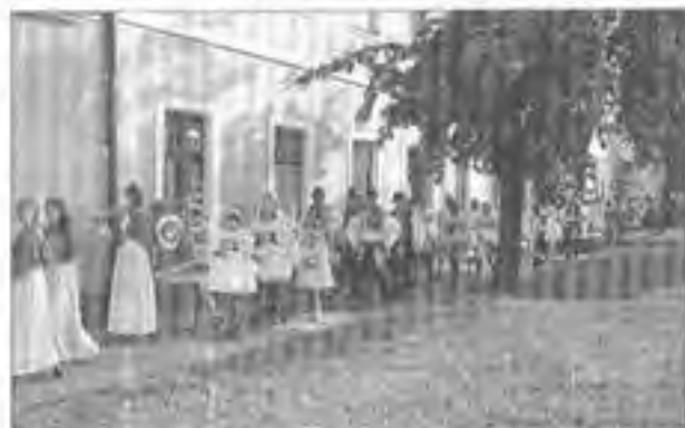
Procesí vychází od kostela sv. Ondřeje