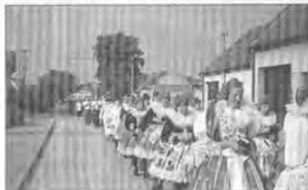
Procesí v Antonínově ulici