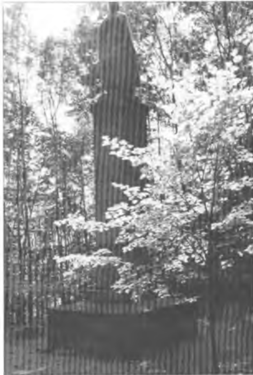
Pozvánka na jezděcí křižovatku Štramberk - Frýdk-Mláka a Provodova dne 3.8.2002 - Socha sv. Barbory ve Světlu na osamělé stezce v Náe anže se Štramberk