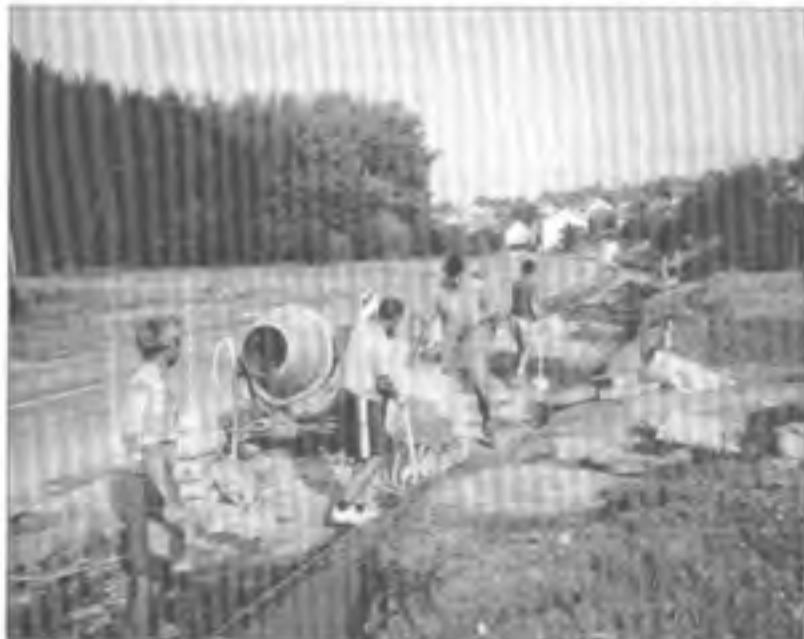
Práce na chodníku pod Humačkovým

Byla zahájena rekonstrukce chodníku při komunikaci I. třídy směrem na Blatničku, která zajistí bezpečnější provoz mezi obcí a koupalištěm.