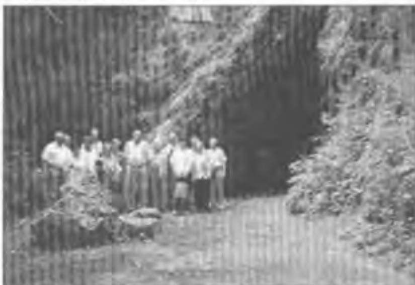
Poznávací zájezd do Štramberka, Frýdku-Místku a Provozního dne 3.8.2002 - Soté výhledu u pravěké jeskyně „Šipka“ a „Národního sadu“ ve Štramberku

Ale to je jenom zdání, to jenom my jsme trochu blíže k nebesům. !