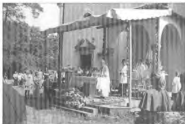
10 o Máj sväté a venkovného ústie v kaple sv. Antonína