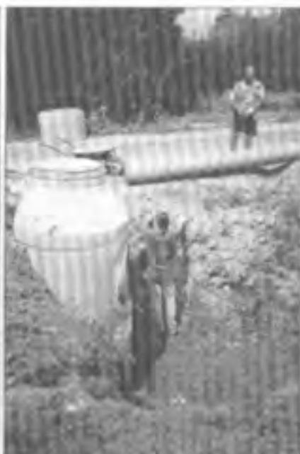
Pracovníci firmy Bachan usazují přechodovou lachtu