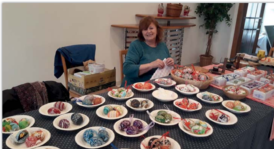
V Blatnici na jarní výstavě. Po otevření výstavy byl její koutek plný návštěvníků.