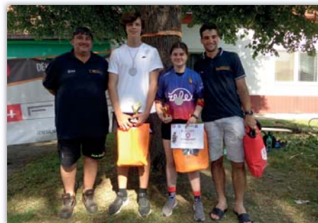
TFA Velká nad Veličkou – trojnásobná účast a trojnásobný úspěch