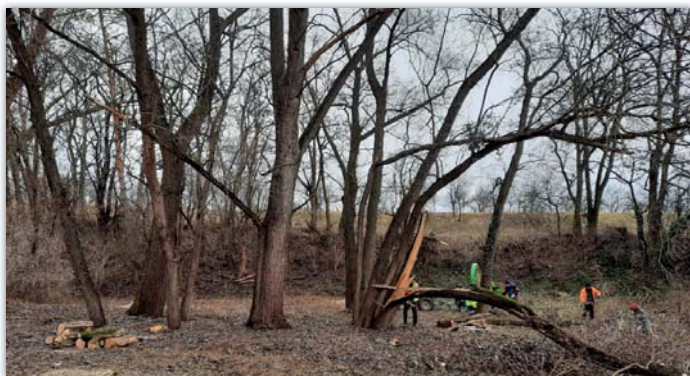
Drůbežka volala po vyčištění pěkně dlouho