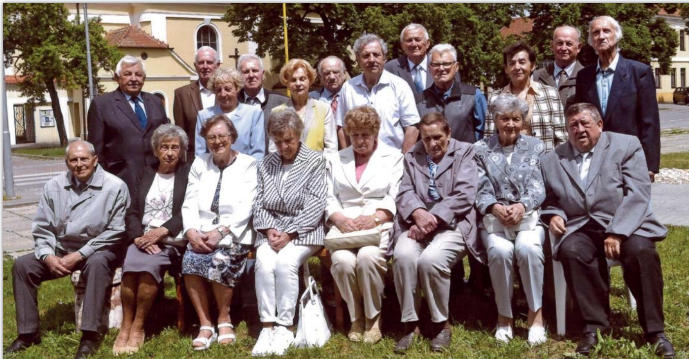
Blatnice pod Svatým Antonínkem 28.5.2022