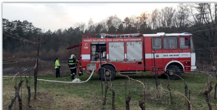
Požár trávy nad Stromečkama zaměstnal čtyři jednotky hasičů

V březnu to byl požár na Strání, který vznikl při práci na opravě plotu. Hořela tráva a hrozilo, že se oheň rozšíří do lesa. Na místo jsme přijeli první a za námi následovaly další 3 jednotky jak profesionálních, tak dobrovolných hasičů z okolí. Oheň se podařilo rychle uhasit a zabránili jsme jeho rozšíření.