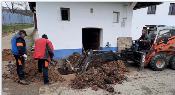
Plníme nejrůznější zakázky občanů