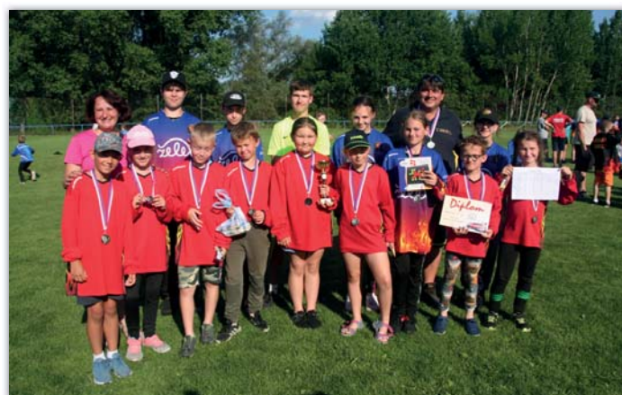
Druhé místo na závodech družstev v Ratíškovicích

Družstvo starších není bohužel kompletní a doplňují je mladší žáci, přesto si vedou docela dobře a obvykle se umisťují v první polovině startovního pole.