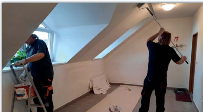
Pracovali jsme na opravách obecních budov