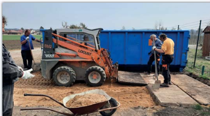
Terén pod kontejnerem na bioodpad se dočkal opravy