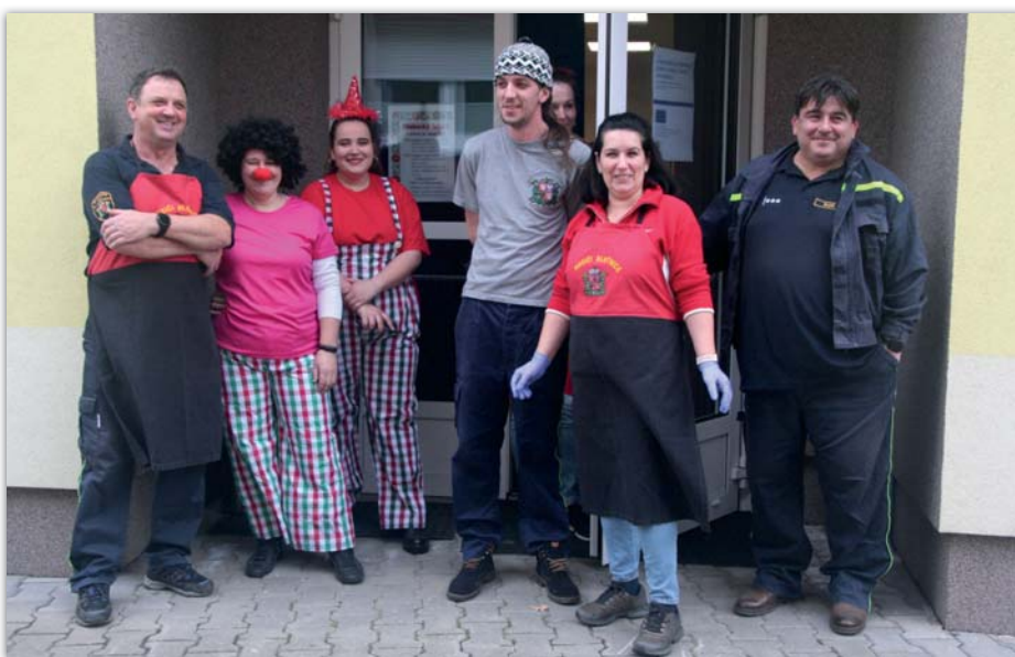
Hasiči nezůstali pozadu