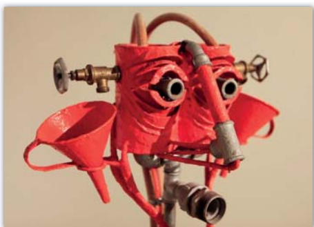
socha z vodovodních armatur