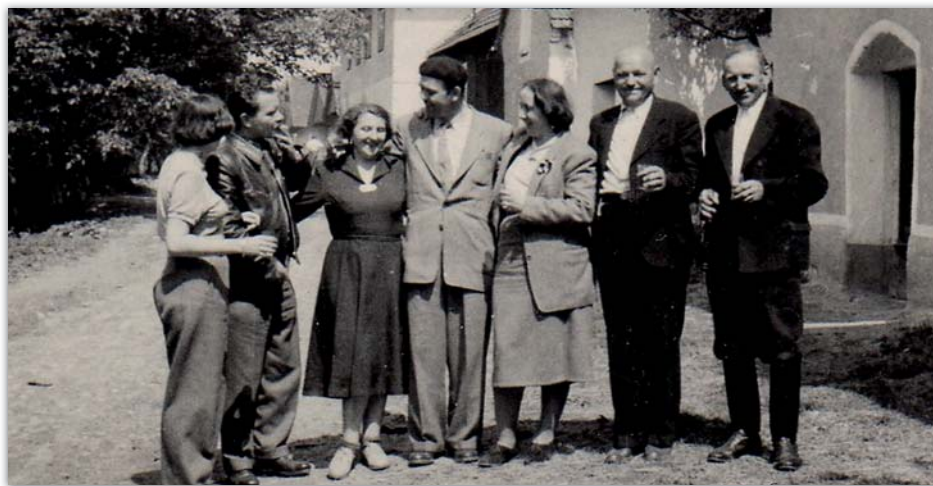
Návštěvníci vinných boud pod Starýma horama