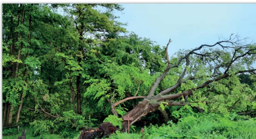
Smíchovská dominanta je již minulostí