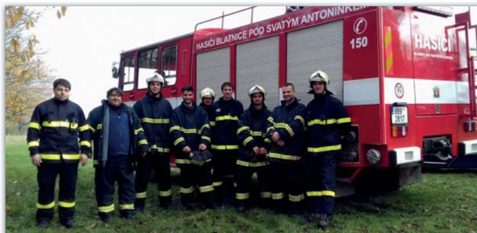
Výjezdová jednotka letos několikrát zasahovala.

vrata pomocí elektrocentrály. Ke všem výjezdům jsme vyjeli ve stanoveném termínu, který je pro dobrovolné hasiče stanoven na deset minut od vyhlášení poplachu. V listopadu jsme byli vybráni k účasti na hasičském cvičení ve Veselí nad Moravou. Šlo o nácvik evakuace, záchranu osob a hašení kina. Na cvičení byli přítomni profesionální hasiči z Veselí a dále dobrovolní hasiči z Veselí, Blatnice a ze Vnorov. Jednotka z Blatnice měla za