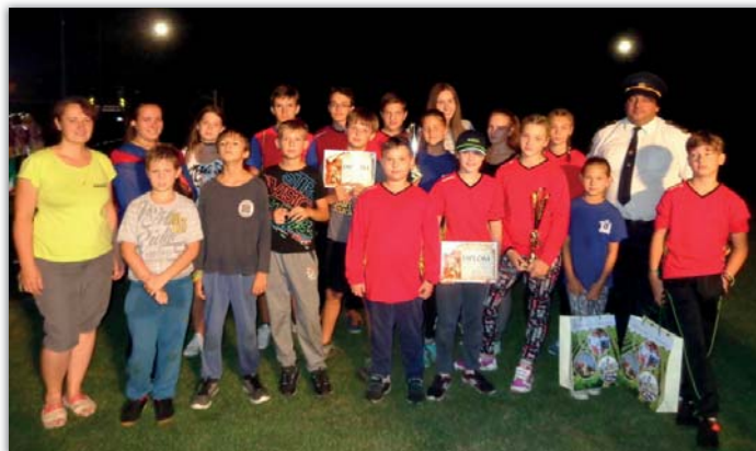
Blatnický tým při prvním ročníku nočních dětských závodů v Blatnici.

Závodům TFA dospělých se letos začal věnovat Ondřej Rybníkář. Zúčastnil se dvou náročných závodů a tvrdý trénink se mu vyplatil. Po heroickém výkonu přivezl domů