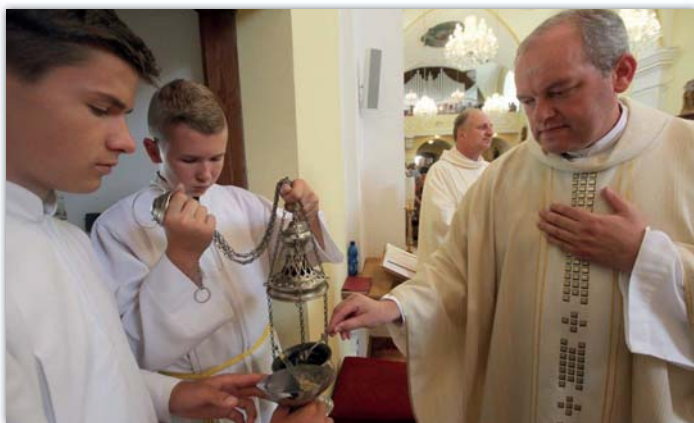
Oltářní obraz požehnal a hlavním celebrantem mše svaté byl Mons. Josef Nuzík, který je dnes pomocným olomouckým biskupem.