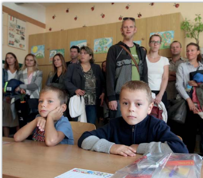
Při zahájení školního roku doprovodili rodiče prvňáčky až do třídy.