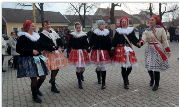
S děvčaty z Vavříнку si s chutí zatančily jejich vedoucí i starší ženy.