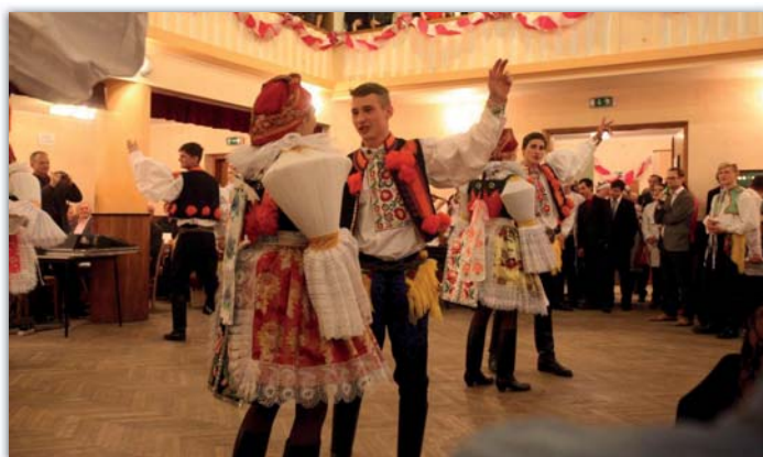
O sobotním hodovém večeru patřila zábava hlavně chase.