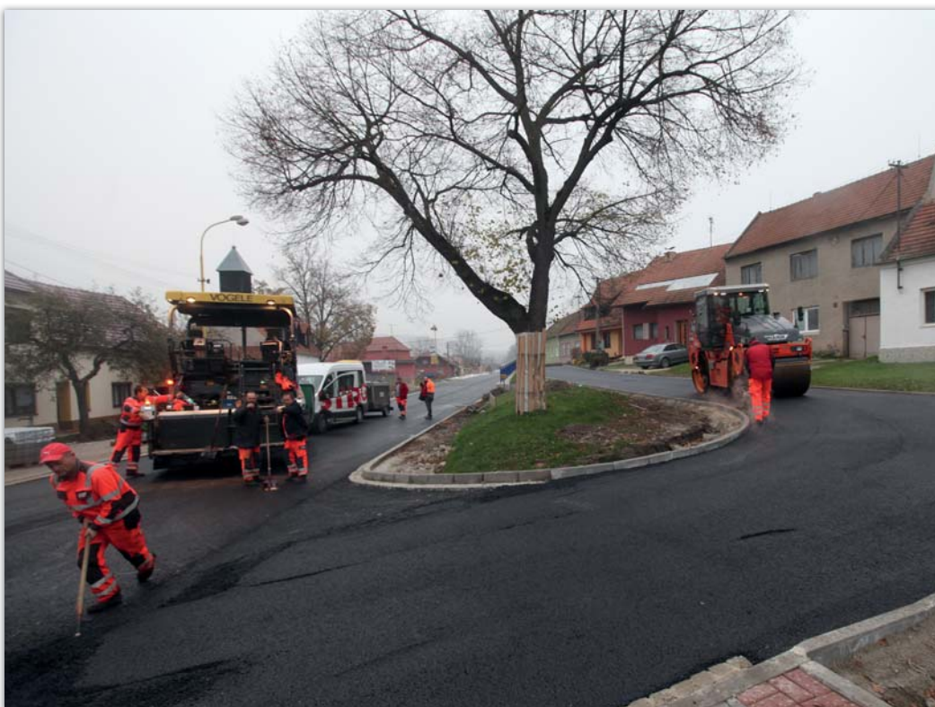
Po dlouhých desetiletích se dočkali kvalitní příjezdové cesty ke svým domům i obyvatelé naproti obecní hospody v ulici „Na kopečku“.

Bez souhlasu všech účastníků řízení by totiž nemohlo být vydáno stavební povolení. Na základě jednání s těmito obyvateli, byly jimi požadované změny zakomponovány do projektu a na ten bylo následně vydáno stavební povolení. Kvůli tomuto projednání jsme byli několikrát na jednáních s pracovníky Ředitelství silnic a dálnic (dále ŘSD) v Brně. Teprve poté následovalo