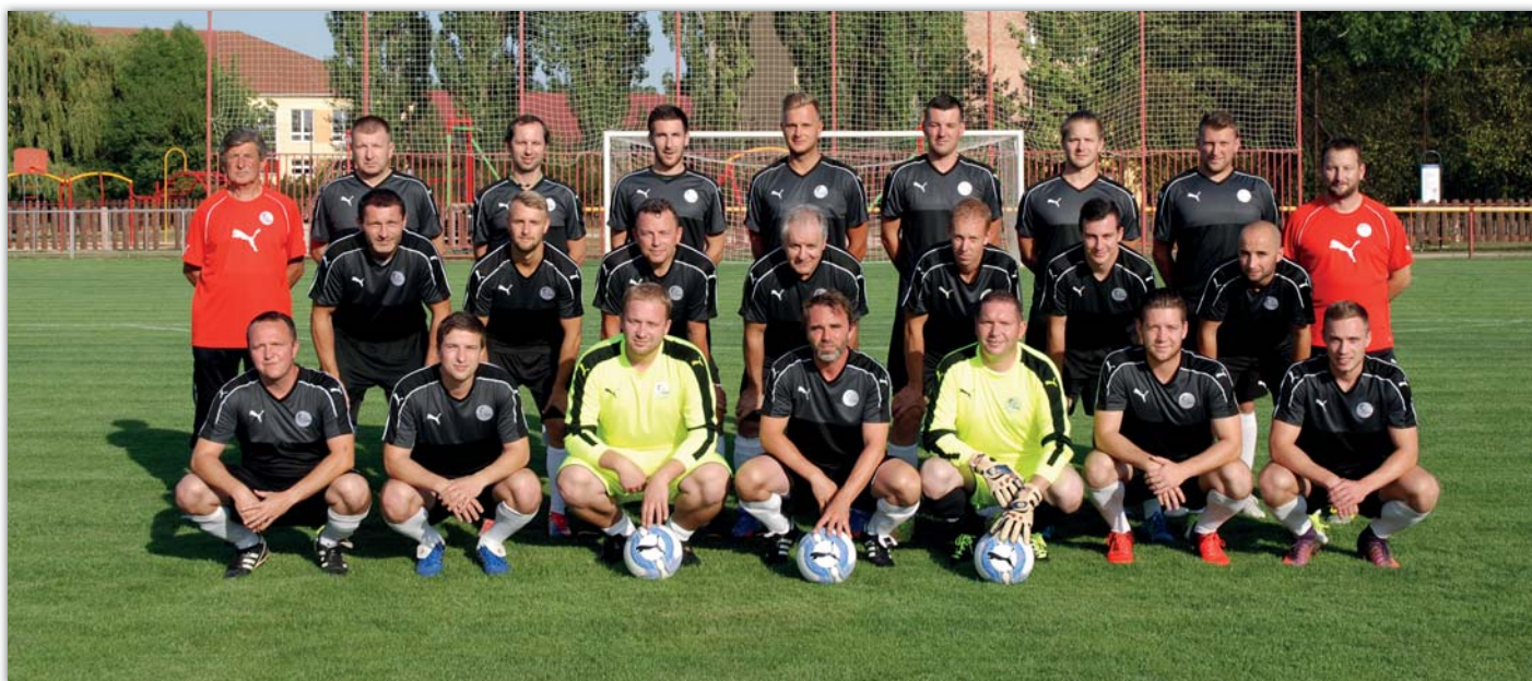
Společný snímek fotbalového týmu vinařů, který bude Českou republiku reprezentovat na přelomu května a června 2018 ve Slovinsku.