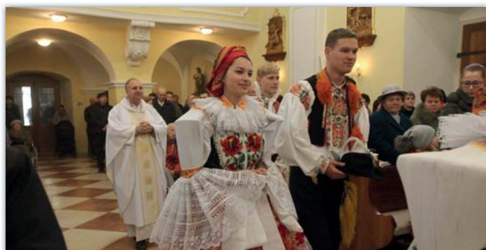
Letošní hodování zakončila mše svatá, na které nechyběli krojovani. Text a 8x foto: Lenka Fojtíková