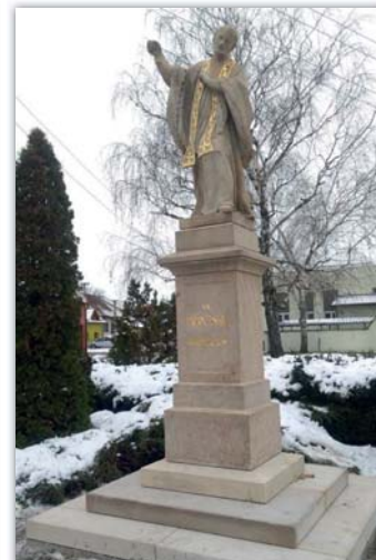
Socha svatého Antonína Paduánského před opravou a po jejím ukončení.