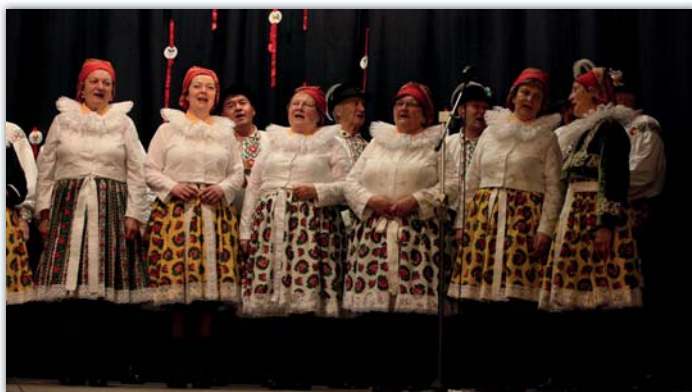
Ženský pěvecký sbor Půtnice z Blatnice slavil desáté narozeniny.