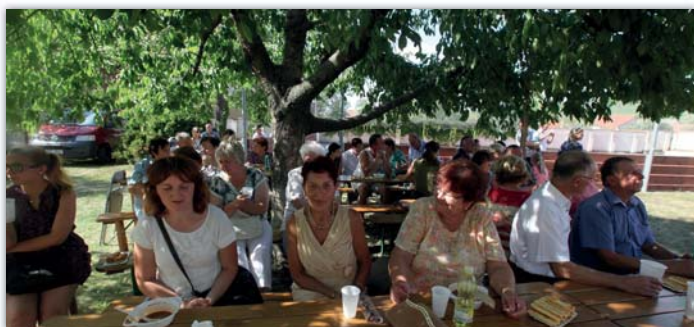
Po mši svaté následoval kulturní program s pohoštěním na farní zahradě.