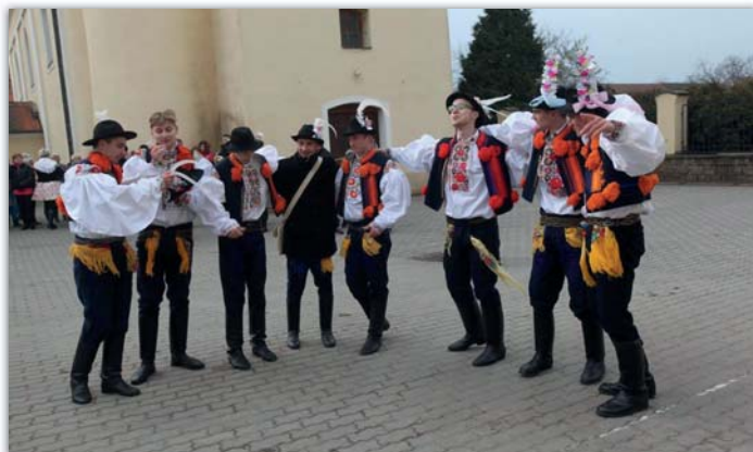
Chlapci z chasy se uměli bavit.