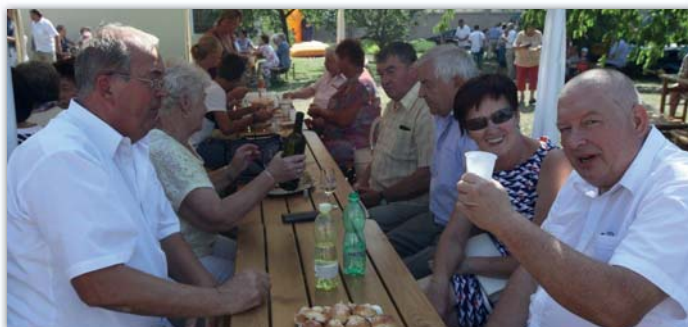
Oslav se zúčastnilo více než dvě stě věřících.