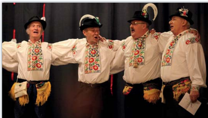
Mužský pěvecký sbor oslavil letos už patnácté výročí svého založení.