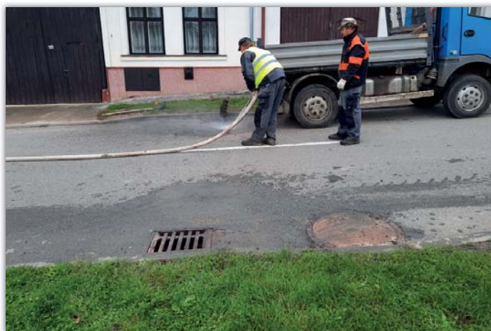
Čištění kanalizace po deštích