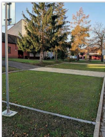
Nové parkoviště u Obecní hospody