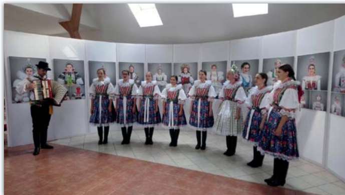
Vystoupení na křestu kalendáře Družičky v Blatničce