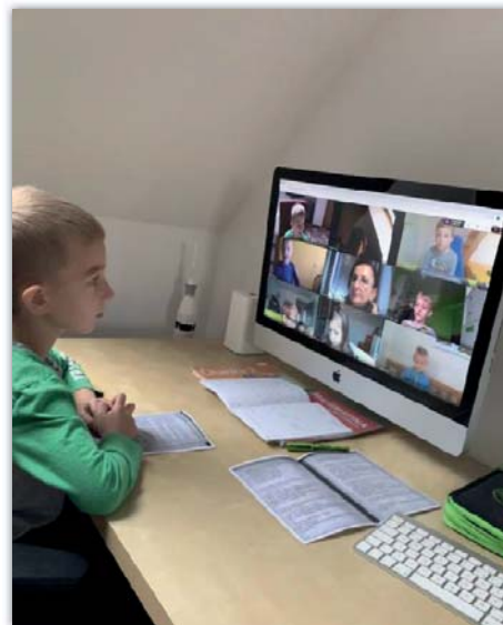
Tak probíhá distanční výuka