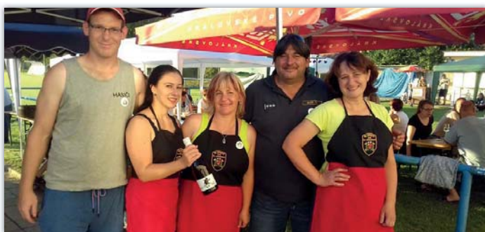
Hasičská partyja na Fazolfestu 2020

V srpnu to byla účast na Fazolfestu, kde jsme si vyvařili první místo. Na dětském hřišti Pod Floriánky jsme při slavnostním předávání nového domečku pro děti uspořádali několik her a soutěží pro děti a zajistili jsme grilování špekáčků.