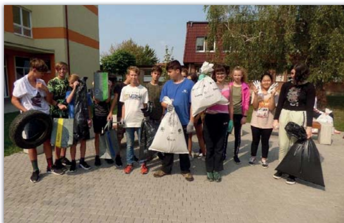
Zapojili jsme se do úklidu