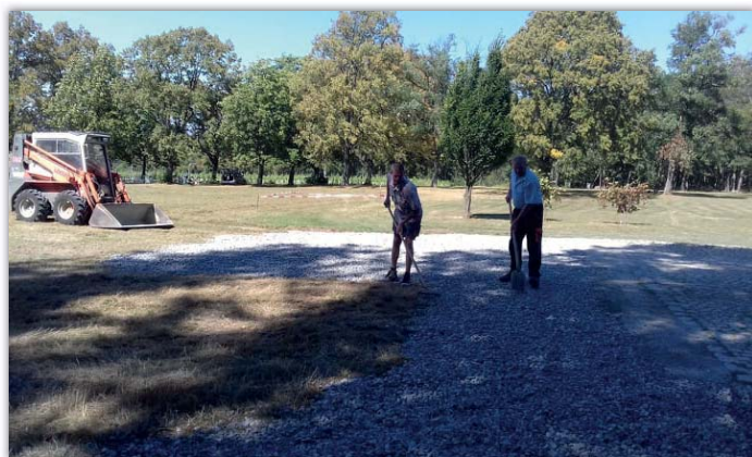
Antoníněk - sjezd z parkoviště na louku už je pohodlnější

Zakázky na vodovodní přípojky a výměny vodoměrů jsme museli omezit na nejnnutnější případy, protože kvůli probíhající pandemii a případné kontaminaci vody jsme nemohli zasahovat do vodovodního řádu. Jakmile to situace dovolí, budeme na jaře pokračovat v připojování nových odběrných míst na vodovod podle přijatých objednávek. Za druhé pololetí roku jsme přesto vyřídili více než 100 nejrůznějších zakázek pro naše spoluobčany.