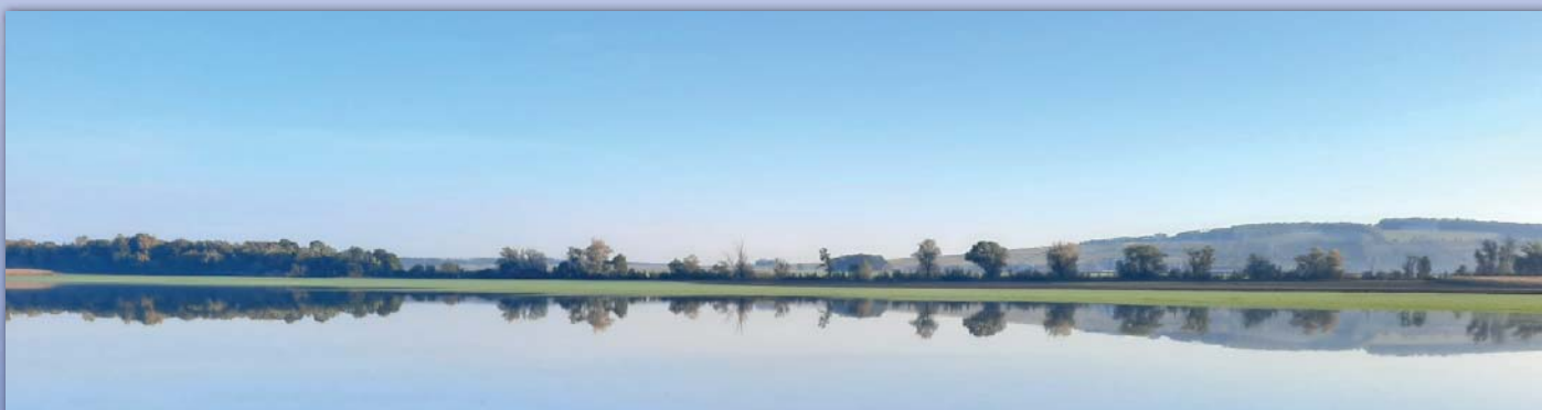
Kde to je? Poznáte, kde byl pořízen tento snímek? Malá nápověda – kopec vzadu je Antonínek. Správnou odpověď najde na straně č. 18.