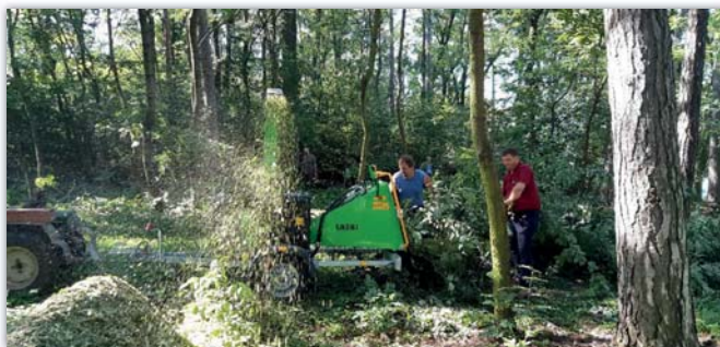
Čištění části lesa na Antonínku