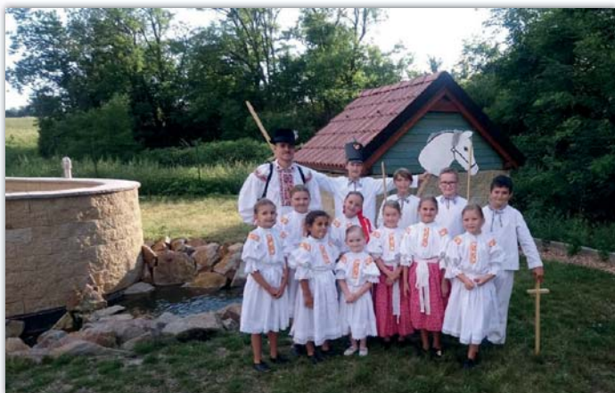
Nové pásmo Vavříнку sklidilo úspěch

Děti z Vavříнку dostaly možnost vystupovat v závěrečném programu kempu ZUŠ Folklorika z Uherského Hradiště v Resortu Rybníček v Blatnici. Děti vystoupily s pásmem Zahrajem sa: Na Turka a Na husičky, které mělo na této akci premiéru. I přes velkou trému dopadlo vše výborně. Moc se těšíme, až se zase budeme moct scházet, opět začneme vystupovat a předvedeme naše nové pásmo na jakékoli jiné akci.