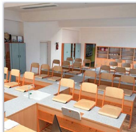
Nová učebna fyziky a chemie