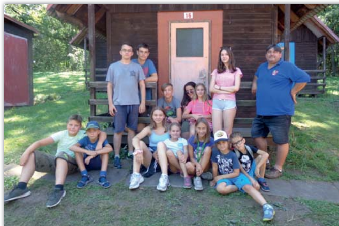
Část účastníků hasičského tábora