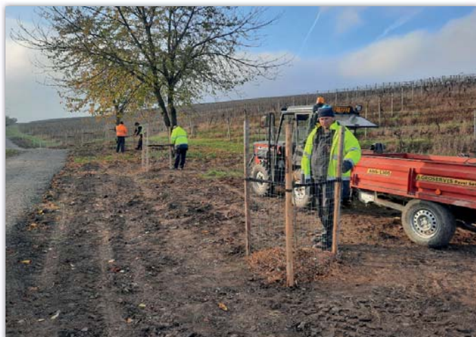
Výsadba nové aleje.