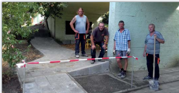
Zahrada školky doznala prvních změn.