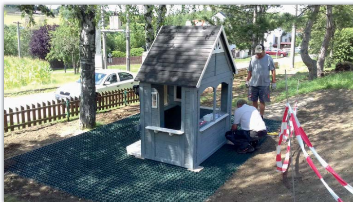
Na dětské hřiště Pod Floriánky přibyl nový domeček darovaný panem Tolarem.