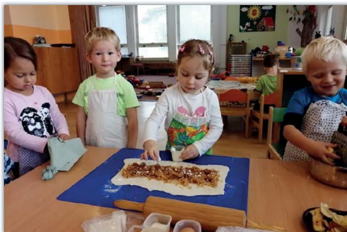
Tááák dobrý štrúdl jsme upekli