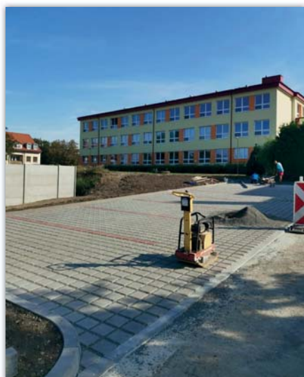
Parkoviště za školou nabízí 8 nových parkovacích míst