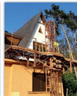
Zateplování štítu na myslivecké chatě