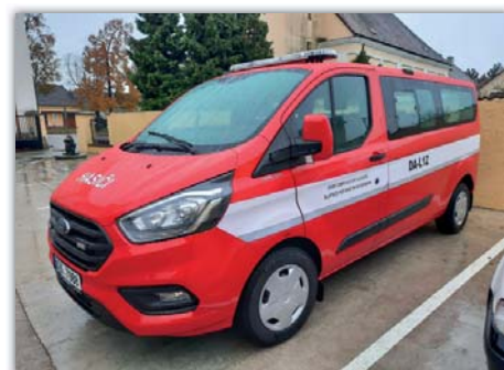
Konečně jsme se dočkali – náš nový dopravní automobil.