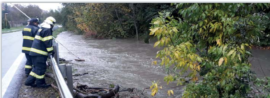
Velká voda na Svodnici – říjen 2020