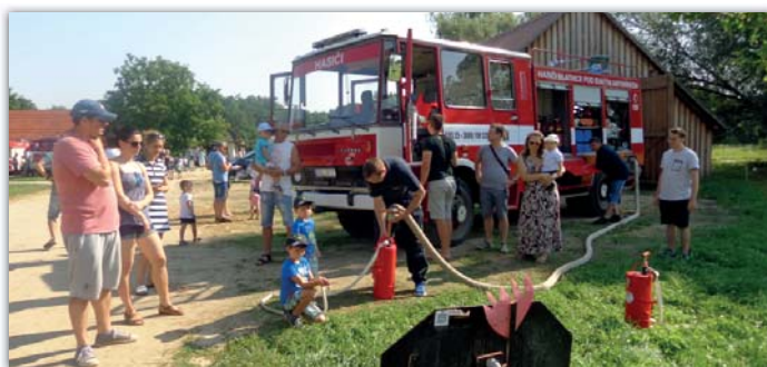
Hasičská neděle ve strážnickém skanzenu