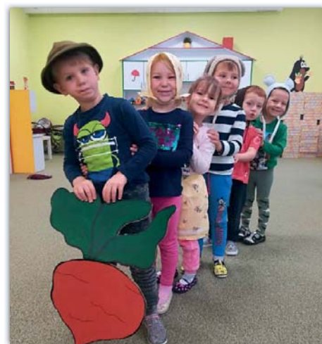
Tááákovou řepu jsme vytáhli