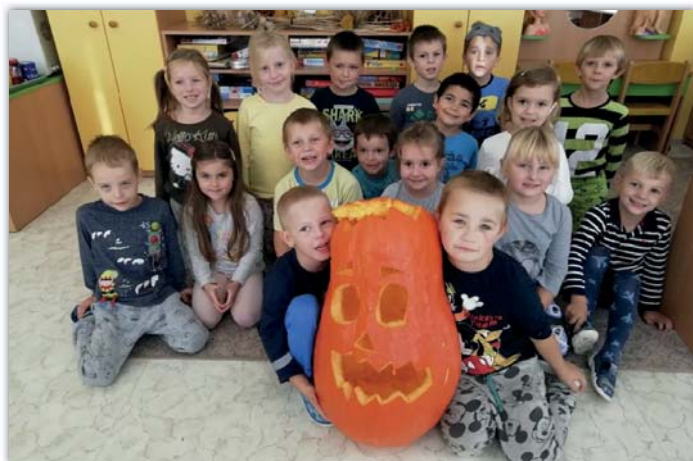
Tááákovou dýni jsme vyřezali