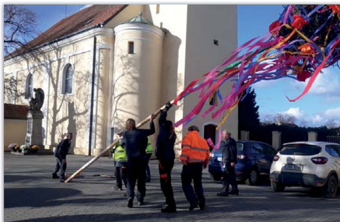
Čí sú hody?! Naše!