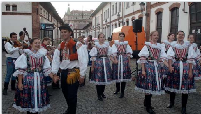
Svodnice na pražské tržnici