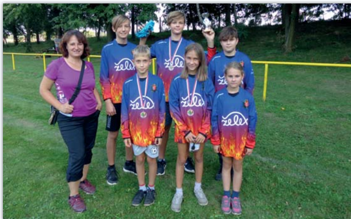
Naši medailisté ze závodů v Petrově