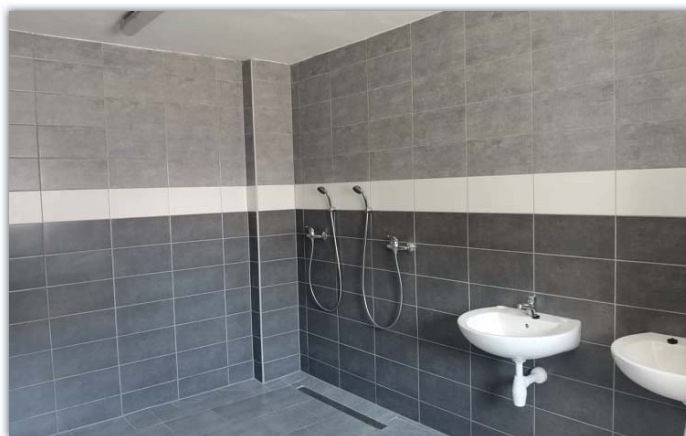
Nové sprchy ve fotbalových kabinách