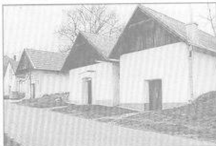
Boudy Pod starým hradiem.

Ze řek má ról záhř, čarnecko střed ról i prázde ze kraj vln š Slováků na příměru vlnom přelobněh měnu vřepim