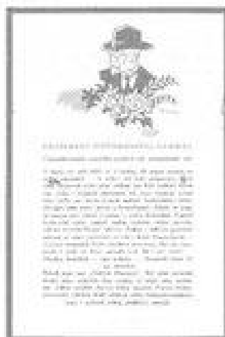
Parta našeho prvního prezidenta