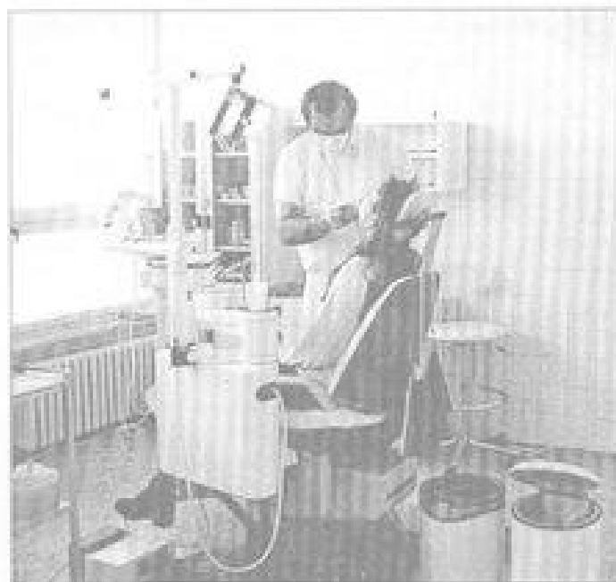
V polní zubní ordinaci se miati hoši