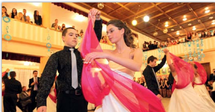
Tradičně nejnavštěvovanější bývá Ples SRPŠ.