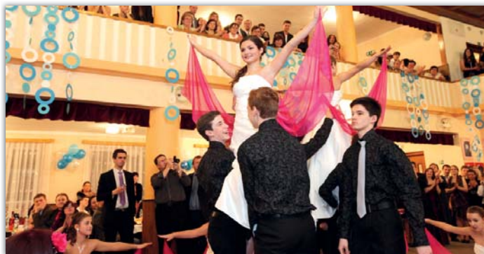
Školáci si na plese SRPŠ zažili svoji společenskou premiéru.