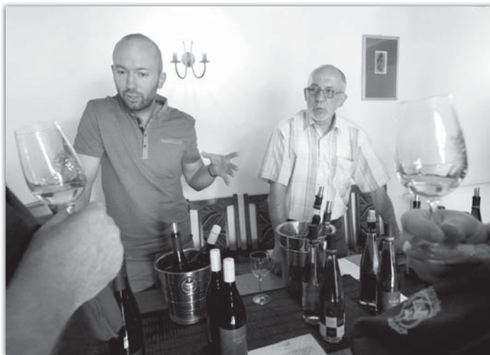
Velmi pěkná atmosféra panovala u Petraturů.

Putováním ale letošní akce vinařů rozhodně neskončily. Od 13.6. do 13.9. je možné navštívit každý víkend některého z blatnických vinařů přímo ve sklepě a ochutnat jeho vína. Za vstupné 100 Kč, mohou návštěvníci ochutnat alespoň šest druhů vín. Skleničky budou k zapůjčení.