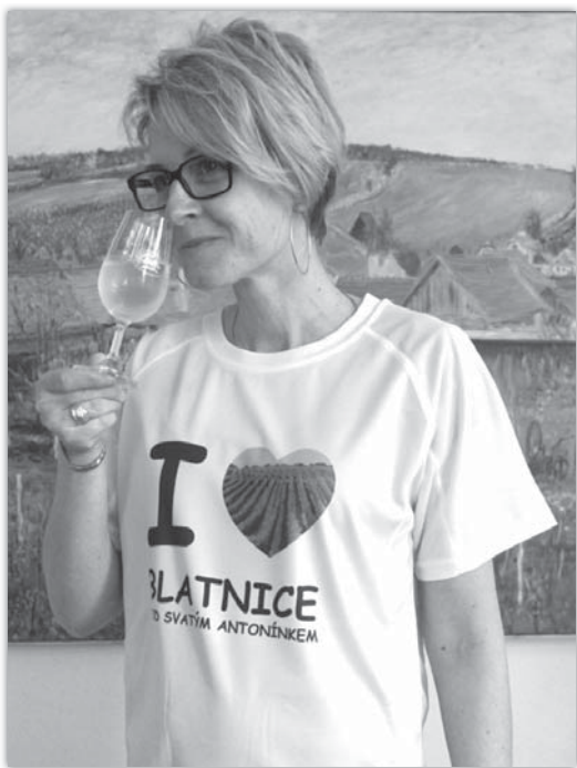
Takto vypadají nová trička Blatnice a Antonínku. Fotografie v srdíčku jsou v současné době se třemi různými motivy.