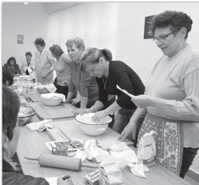
O kurz krajanců byl mezi ženami mimořádný zájem.