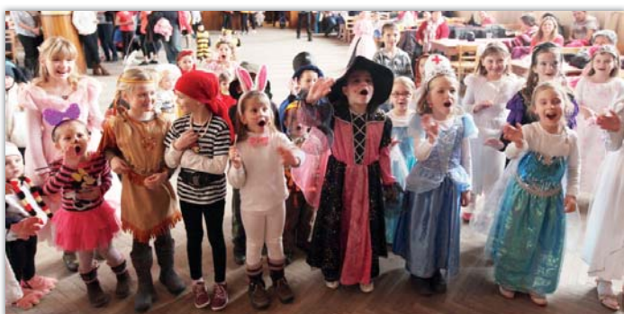
S mimořádným zájmem se setkal také Maškarní ples, připravený pro děti Sdružením rodičů a přátel školy.