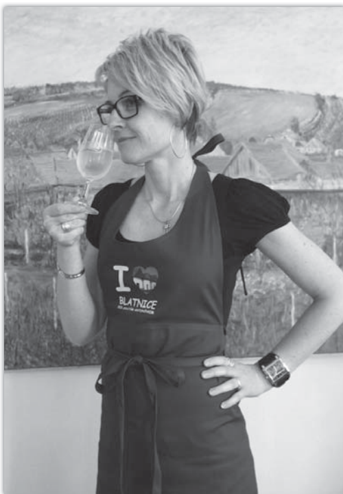
Zájem byl i o zástěry s motivem búd.