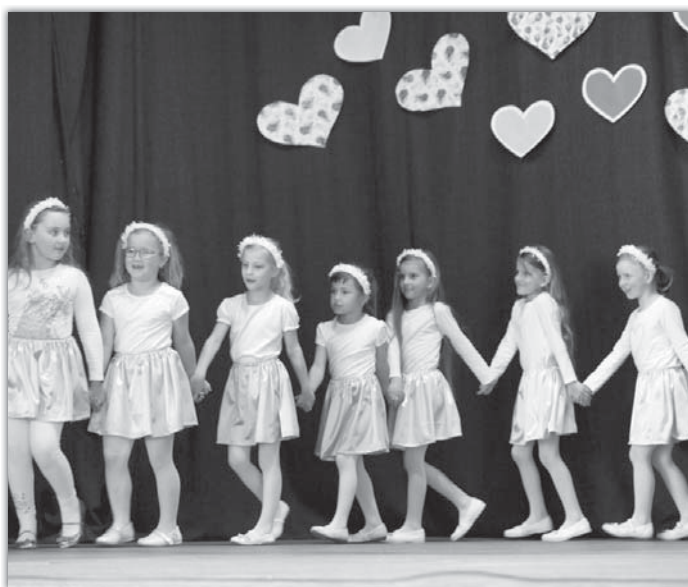
Prvními gratulanty maminkám a babičkám byly děti z mateřské školy.

rozzářené oči a bouřlivý potlesk. V programu vystoupil také ženský pěvecký sbor a bouřlivé ovace sklidily mažoretky z Ostrožské Lhoty.