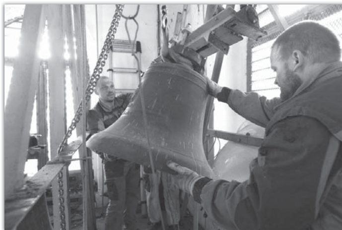
Pracovníci firmy Boroko nejdříve zvony sňali a v rámci oprav také pořádně vyčistili.

a končili půl hodiny po půlnoci. Na slavnost sv. Josefa věřící na mši svatou zval už krásný hlas opravených zvonů. Cena rekonstrukce se pohybovala okolo 300 000 Kč. Náklady hradila farnost z vlastních zdrojů.