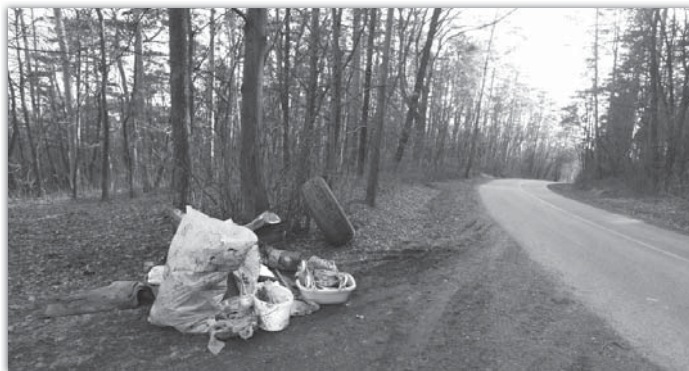
Tuto hromadu odpadků v lese nasbíral a odnesl Roman Židlík, který nás motivoval, aby se Blatnice zapojila do celostátní akce Uklidme Česko.