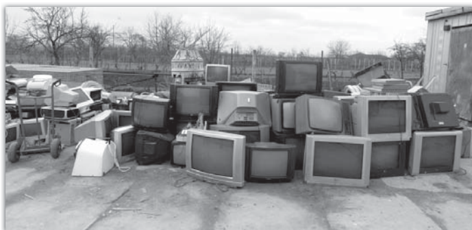
Lidé se zbavili i řádné hromady televizorů.