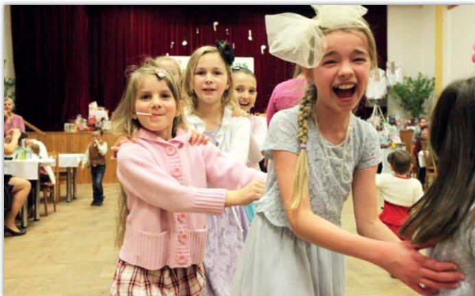
Čaj o páté aneb farní ples je určen všem generacím.