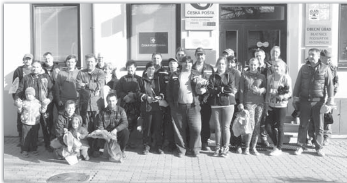
Společný snímek dobrovolníků, kteří se zapojili do celostátní akce Uklidme Česko. Některé skupiny jsou zastoupeny pouze jedním členem, který přišel vyfasovat plastové pytle a ochranné rukavice.