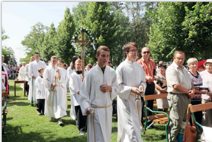
Hlavní poutě se zúčastnily tisíce lidí ze všech koutů naší země i ze Slovenska.