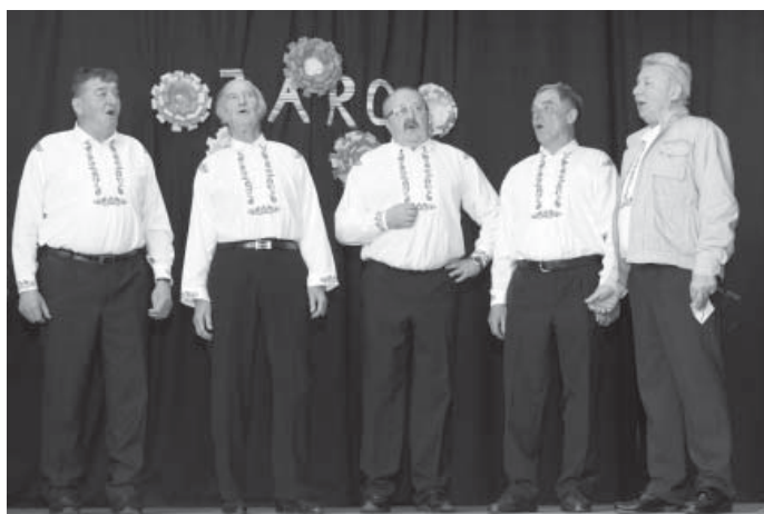
V programu vystoupil mužský pěvecký sbor z Blatnice, který si pozval smíšený pěvecký sbor z Horního Němčí.