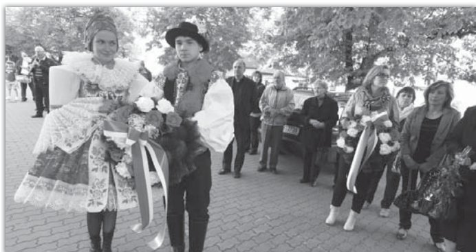
Věnec padlým obětím položil krojovaný pár.