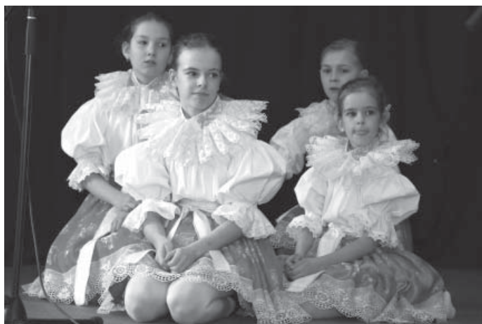
Svým vystoupením seniory potěšil také folklorní soubor Vavřínek.