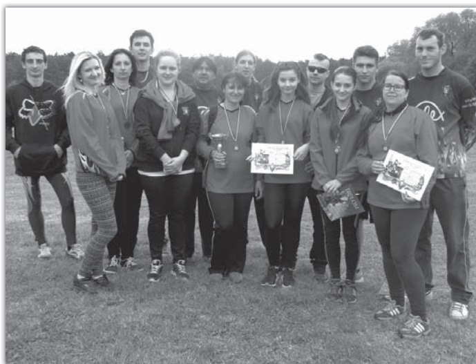
Blatnické hasiče při závodech reprezentuje Fire Team.