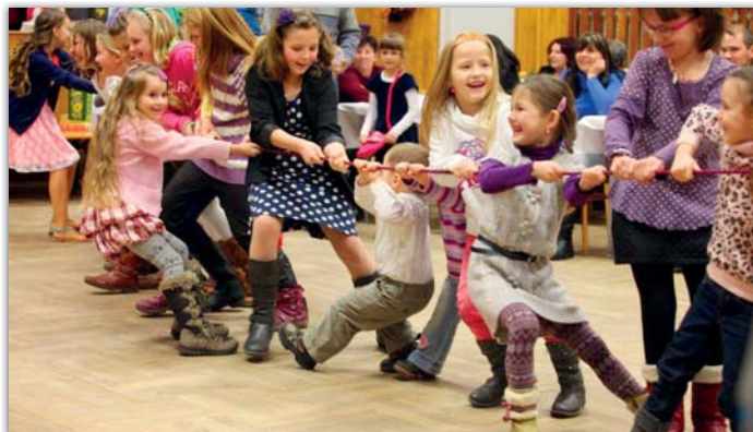
V pozdním odpoledni přicházejí především děti, které se i letos skvěle bavily.