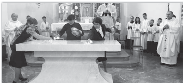
Při svěcení arcibiskup Jan Graubner pomazal celý oltář křížem, což je posvěcený olej, kterým jsou například pomazáni lidé při křtu či kněžském svěcení. Ženy na snímku oltář od oleje čistí.