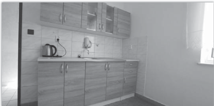
Pohled na novou kuchyňku v suterénu ubytovny, kterou instalovali pracovníci Služeb obce Blatnice.