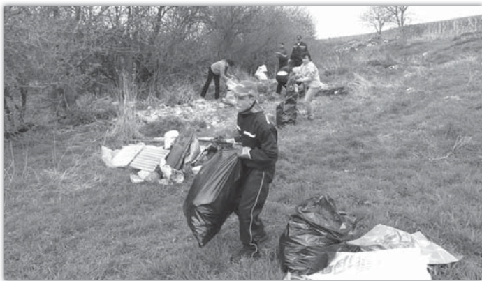
Hasiči odvedli řádný kus práce.