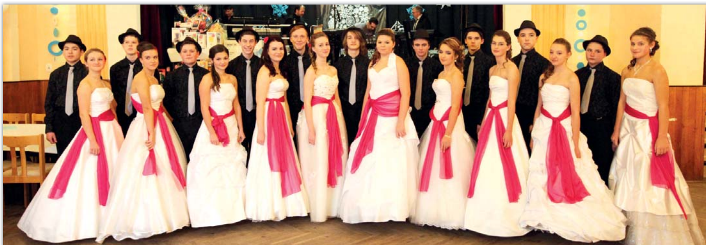
Polonézu letos tančilo deset párů.