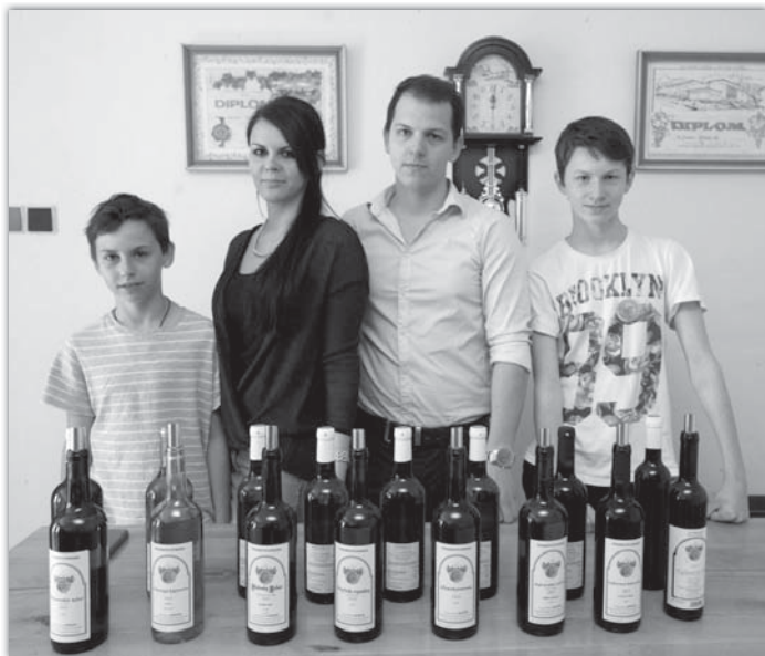
Ve sklepě u Straků se obsluhy ujaly čtyři šikovné děti.

Bezmála tisícovka účastníků se akreditovala v předstihu prostřednictvím internetu. Podle Aleše Ratajského z Cechu blatnických vinařů se začalo s elektronickým přihlašováním už před třemi lety. „Vypla-