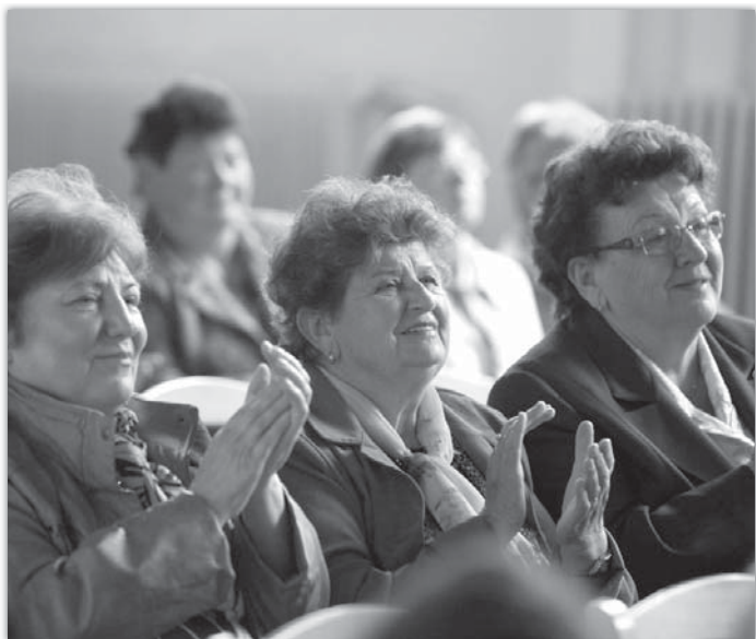
Účinkující byli odměněni bouřlivým potleskem.

Druhou květnovou neděli připravil kulturní výbor pěknou oslavu Dne matek. Děti přišly maminkám a babičkám popřát zpěvem, tancem i hrou na kytaru. Odměnou jim byly