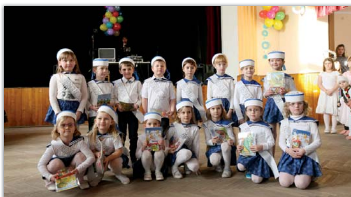
V rámci Maškarního plesu byly děti pasovány na předškoláky.