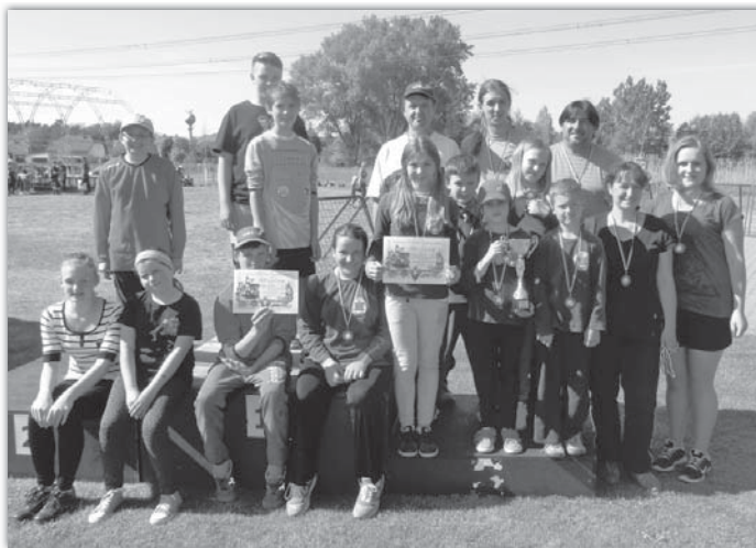
Mladí reprezentanti Blatnice ve Vacenovicích.

Starší žáci se rovněž neztratili, i když trénování některých disciplín bylo komplikovanější kvůli dojíždění dětí z Kozojídek. Dvakrát skončili na nepopulárním, přesto krásném čtvrtém místě.