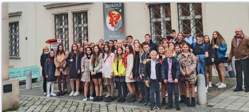
Jedeme na balet