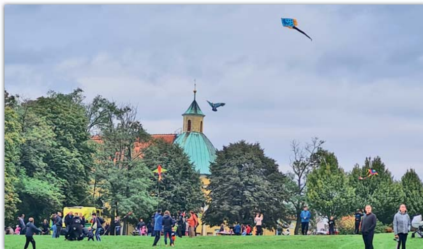
Antonínka plný lidí a nebe plné draků