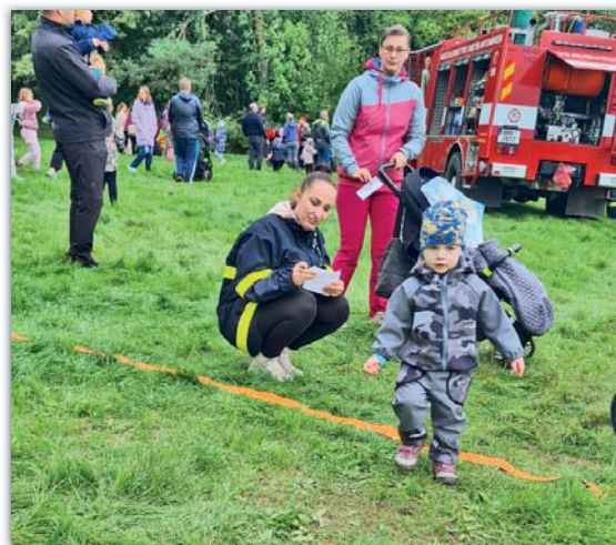
Také spousta soutěží, her a zábavy