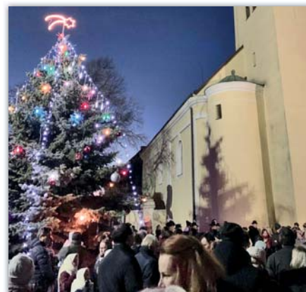
Vánoční strom se rozsvítil na první Adventní neděli