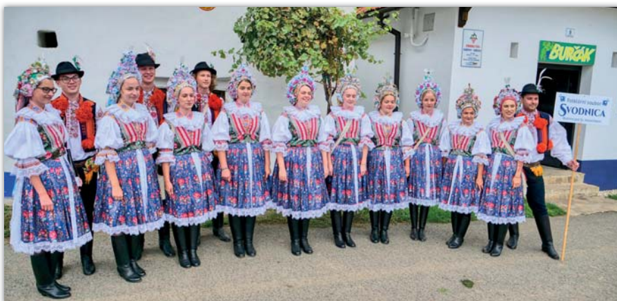
Krásná mláďa a blatnických krojů