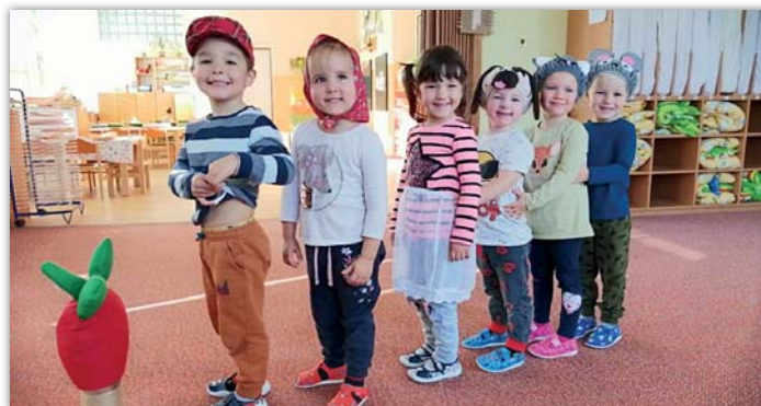
O veliké řepě