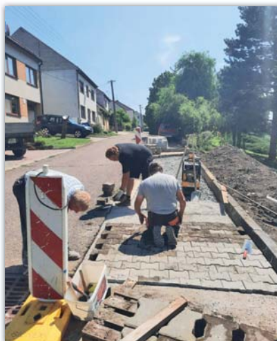
Jedna ze zakázek občanů – vybudování parkoviště

Naši zaměstnanci se připojují k přání krásných svátků a všeho dobrého v Novém roce.