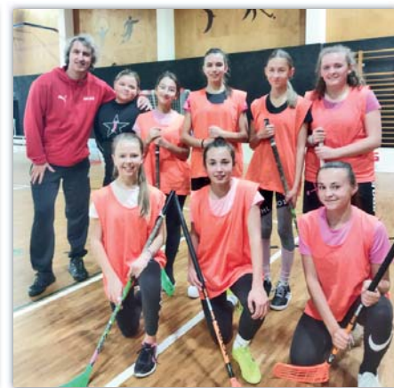
Dívčí florbalový tým