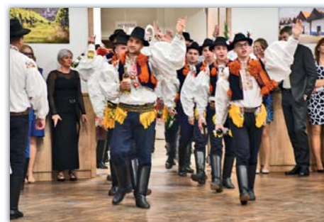
Čí sú hody? Naše!

Hodové fotografie pořídila Viktorie Martinková Renata Stupalová