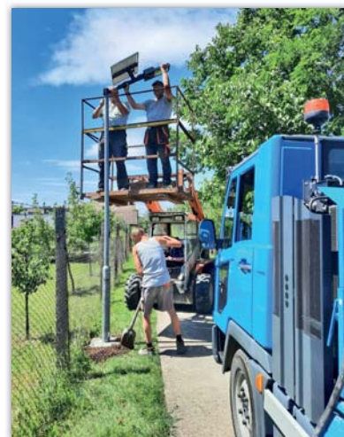
Osvětlení uličky mezi Dědinou a Lúčkama