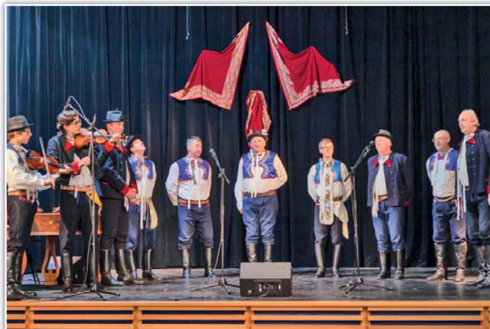
Přijel i mužský pěvecký sbor z Kněždubu