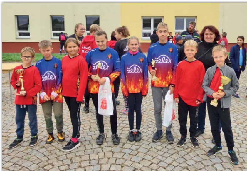
TFA Strážnice – naše mladé naděje