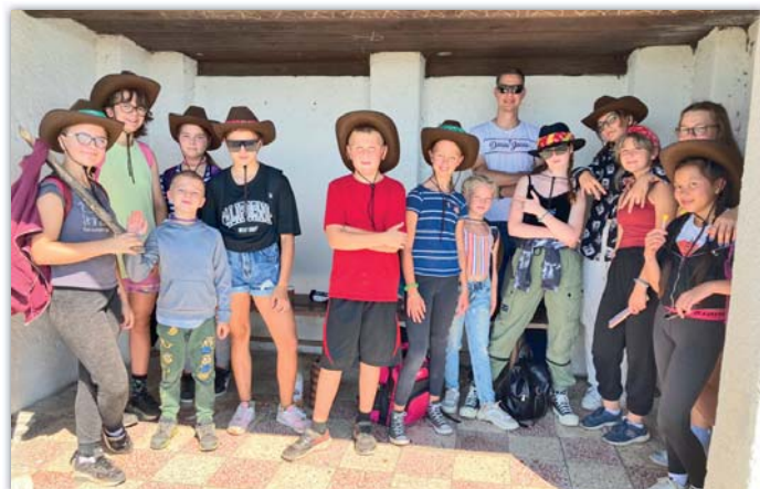
Letošní westernový tábor