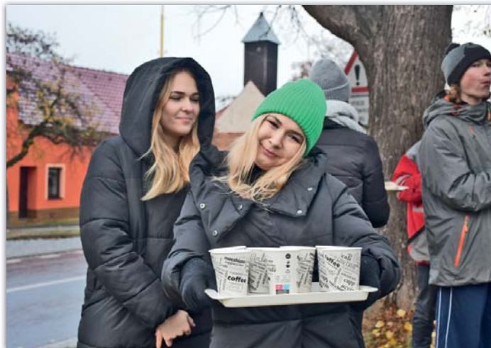
Občerstvení přišlo v sychravém počasí vhod