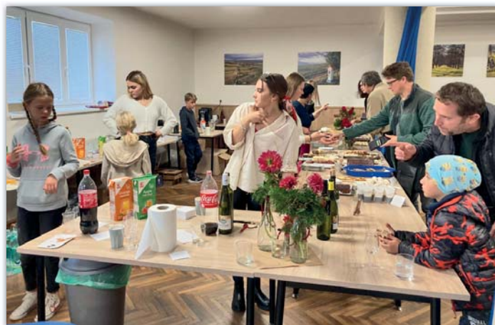
Do obsluhy se zapojili mladí