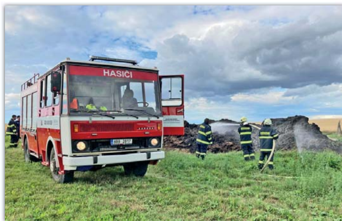
Požár hnoje - letos hořel několikrát