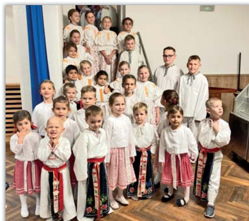
Naše malé naděje