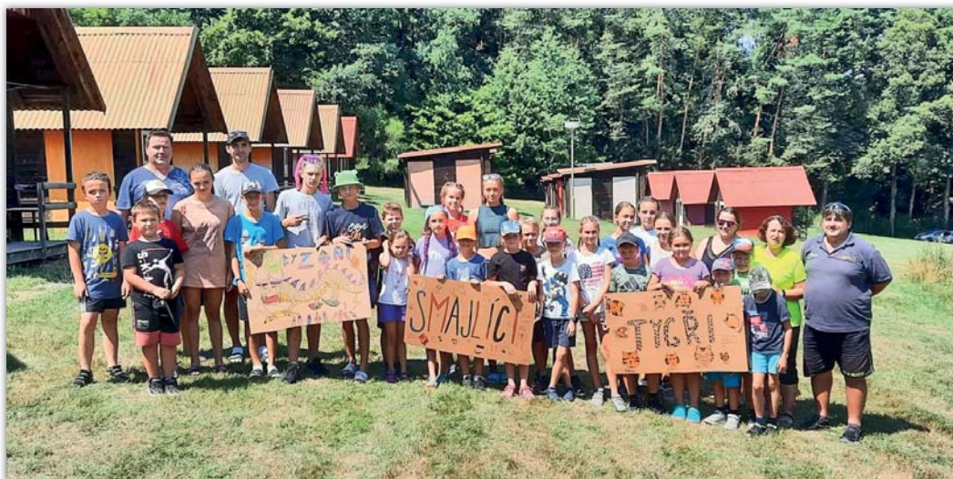
Letošní tábor na Babí Hoře