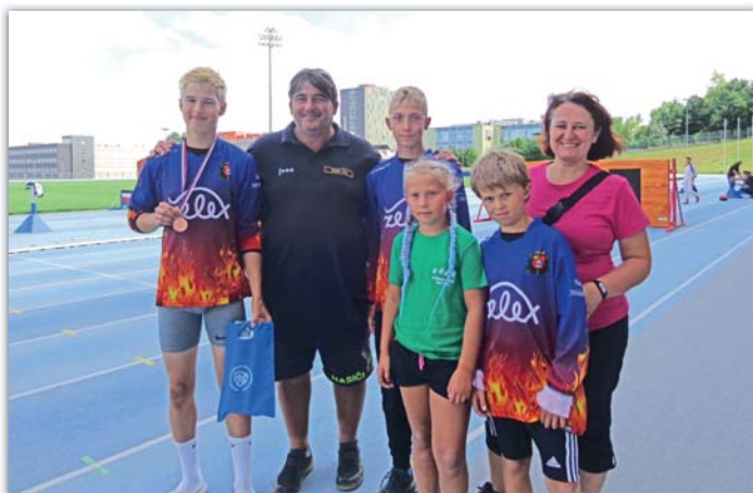
Krajské „šedesátky“ v Brně