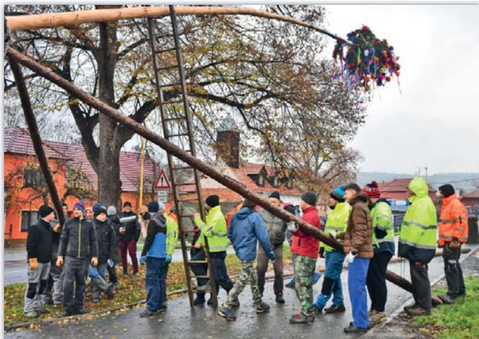
Při stavění máje byla potřebná každá ruka

sí do provizorně otevřeného Obecního hostince na něco pro zahřátí a nebo si jen tak posedět u piva, protože hody a tato hospoda – to přece patří k sobě.