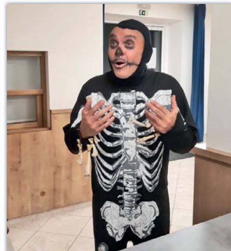
Kostlivec, nebo Tonda?