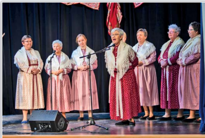
Hostující soubor Nezdenské tetičky