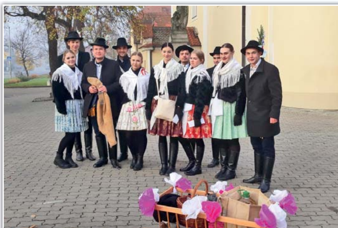
Chasa vyráží na obchůzku

byly v ulicích slyšet hodové písničky. Snad chasa zvládla pozvat všechny a pytláři měli co nést, protože tradice by se měly udržovat, abyhom se o nich nemuseli dočítat jen v starých tiskovinách.