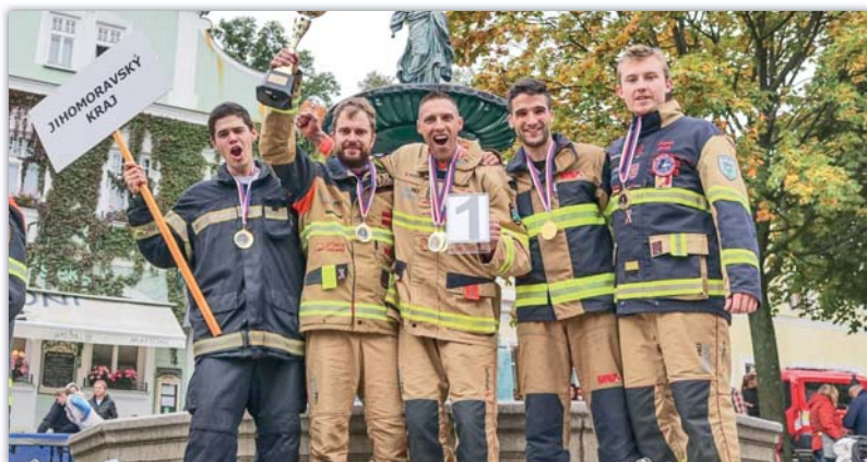
Ondra je Mistr republiky a tým JMK také zvítězil