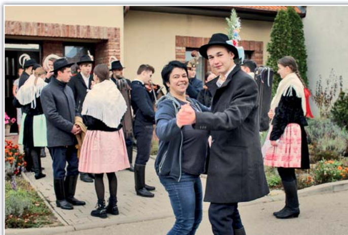
Nikdo jim neunikl