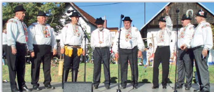
Zpívá jim to spolu už 20 let