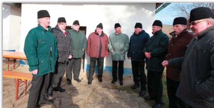
Zpěv mužského pěveckého sboru se při oslavách fašanku nesl daleko do kraje.