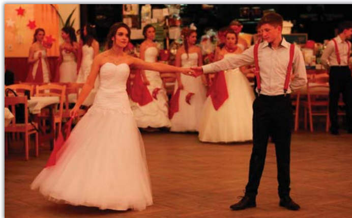
Představení letošních tanečních párů tradičního Plesu SRPŠ.