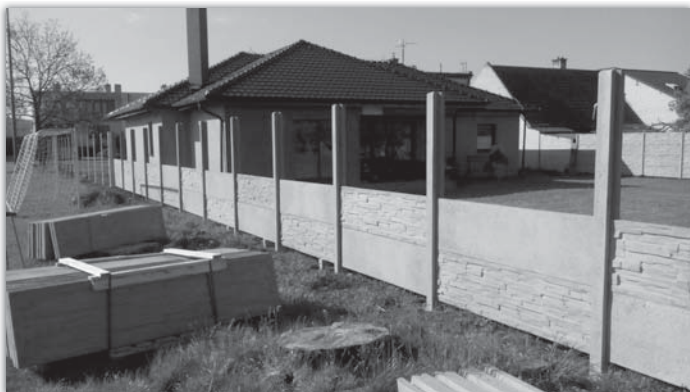
Odborná firma postavila na fotbalovém hřišti nový plot, ale demontáž toho starého provedli pracovníci SOB.