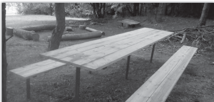
U tábořiště na Antonínku (v lesíku vedle křížové cesty) pracovníci SOB vybudovali nový stůl s lavicemi. Vzniklo tak další místo k odpočinku poutníků i turistů.