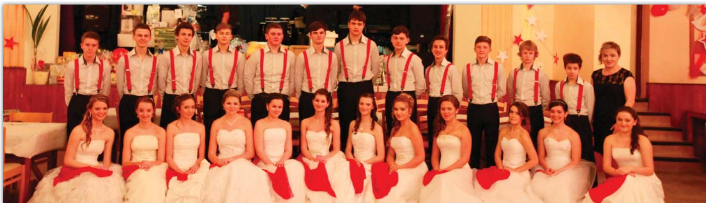
Společný snímek letošních tanečniců ze základní školy.