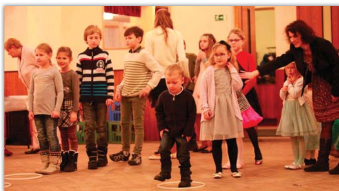
Farní ples se letos uskutečnil v blatnickém kulturním domě.