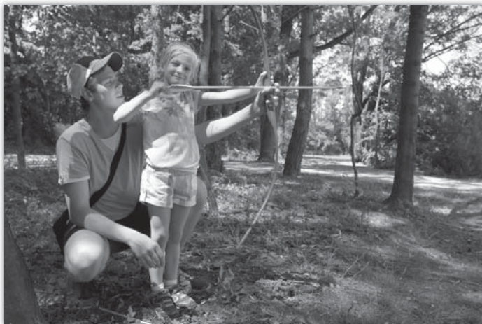
Na účastníky Antonínova léta čeká i letos spousta zábavy.