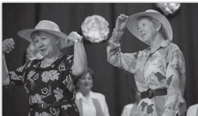
Blatnické zpěvačky mají spoustu nápadů, a tak pro seniory připravily nové pěvecké číslo.