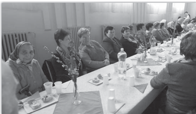
V únoru se opět uskutečnila Beseda se seniory, která se setkala se zájmem našich dříve narozených spoluobčanů.