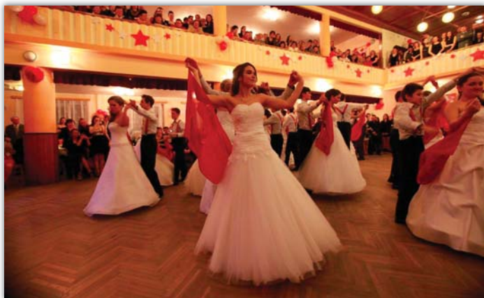
Ples SRPŠ patří k nejnavštěvovanějším a mnozí tvrdí, že i k nejkrásnějším, protože mu vládne nová generace.