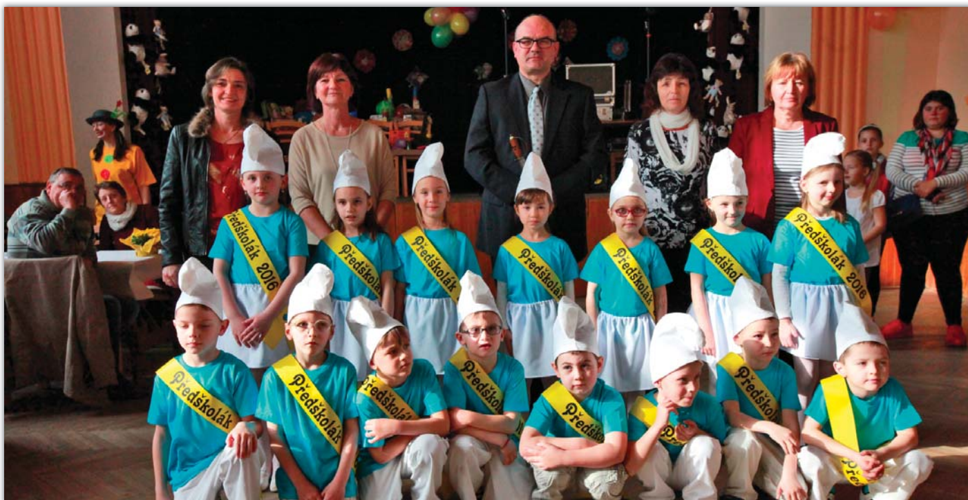
V březnu bylo pasováno patnáct dětí z mateřské školy na předškoláky.