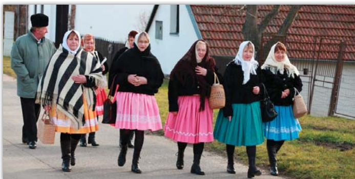
Na fašanku pod Starýma horama nemohly chybět Půtnice z Blatnice.