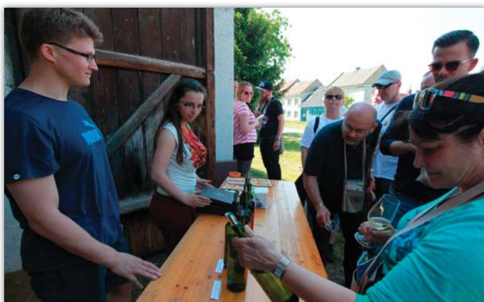
Putování po blatnických búdách letos přilákalo zhruba 1 600 návštěvníků, což je o dvě stě více než vloni.