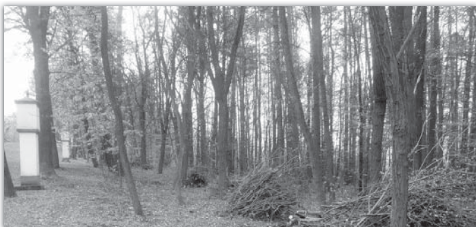
V měsíci dubnu pracovníci SOB vyčistili les podél křížové cesty na Antonínku. Do brigády se jedno odpoledne zapojili i místostarosta a starostka obce.