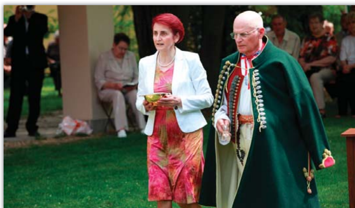
První červnovou neděli se na Antonínku uskutečnila historicky první pouť moravských matic. Na mši svaté byli zástupci Matice svatoantonínské, velehradské, svatokopecké, svatohostýnské a radohoštské.