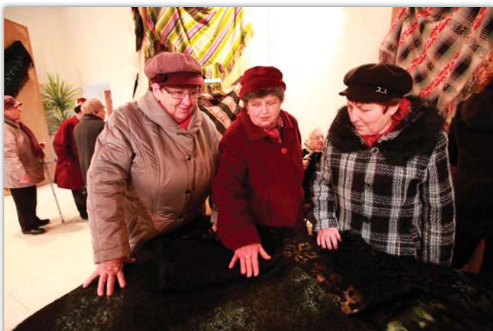
Únorovou výstavu si se zájmem prohlédly především ženy, které už patří mezi pamětnice.