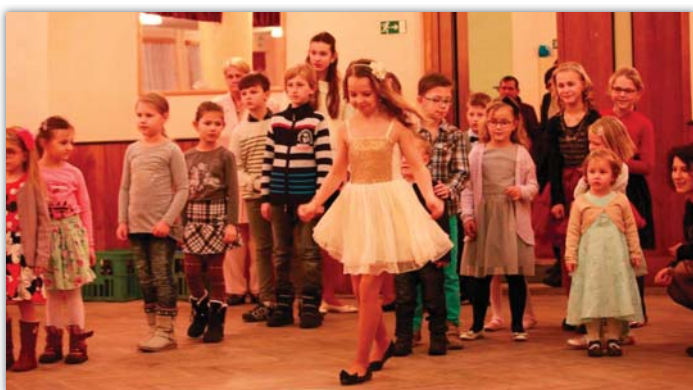
Farní ples patří každoročně i dětem.