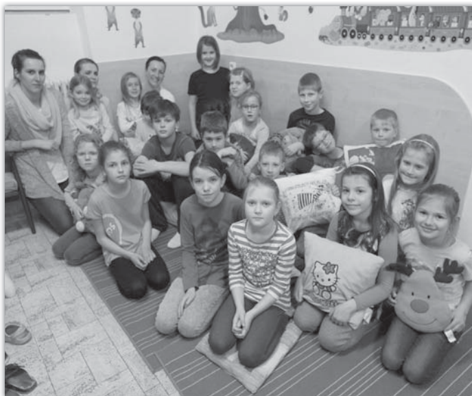
Společný snímek všech účastníků letošní Noci s Andersenem v blatnické knihovně.