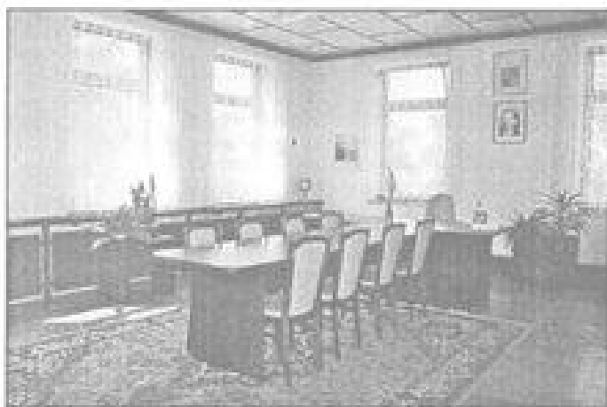
Bývalá 3. třída „staré školy“ se proměnila v pracovní stanici.