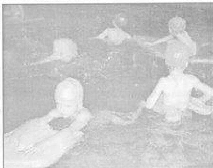
Proti obezitě je vhodné se brzoit mnoha sporty. Jedním z nich je i skákaní Na zemku jete při výuce skákaní obě z mateřské školy