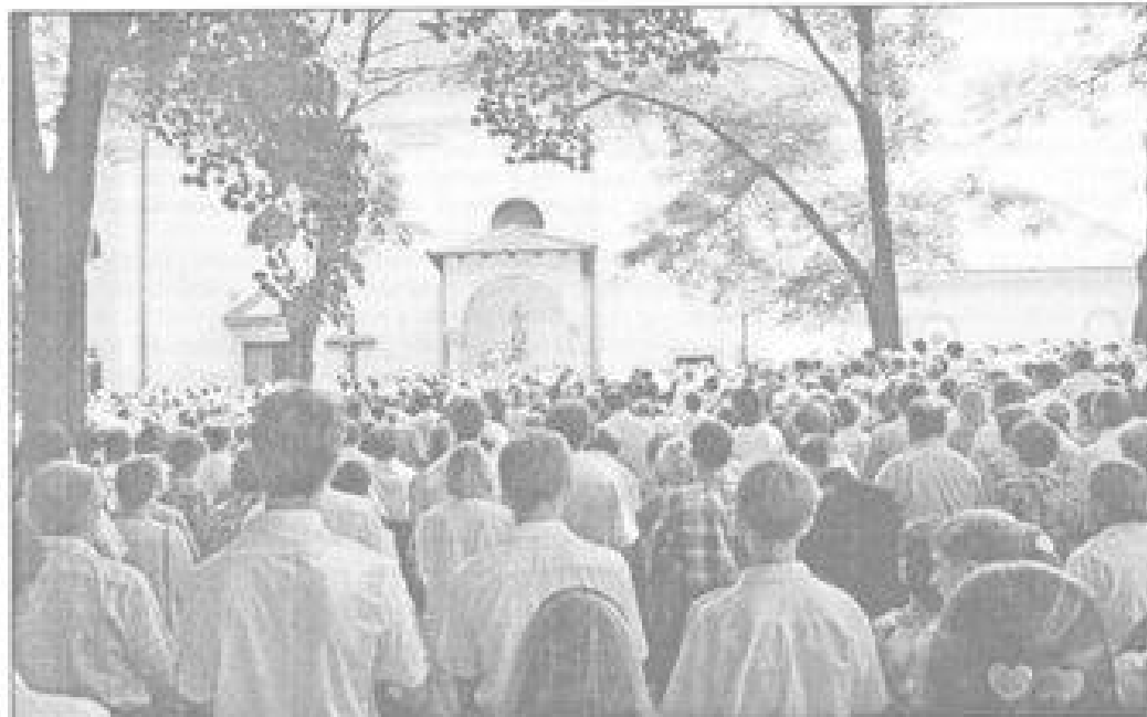
Děkujeme panu vs. Antonínem se uskutečnilo 25. srpna.