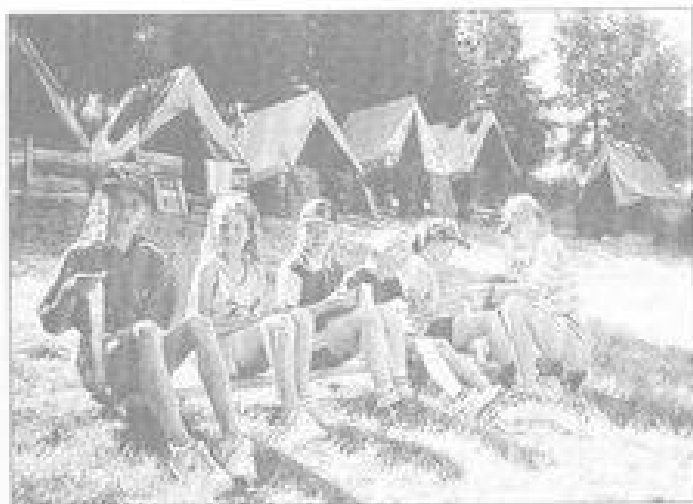
Za chvíli tu budou „indiáni na Valašsku“.