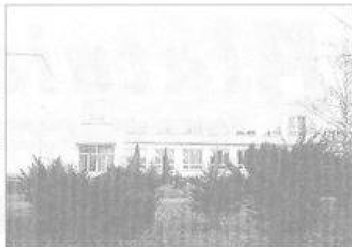
Za krásnou budovou naší školy se přece jenom skrývají problémy.

- návrhovač vzal svůj návrh na zahájení řízení zpět nebo se, ač řádně a včas předvolán, k ústnímu jednání bez náležité omluvy nebo bez důležitého důvodu nedostavil, bude návrhovačeli uložena povinnost uhradit sítu náklady spojené s projednáváním přestupku stanovené vyhláškou 251/1996 Sb. ve výši 500,- Kč.