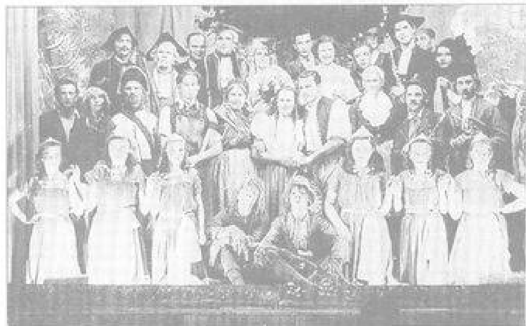
Fotografie při premiéře.