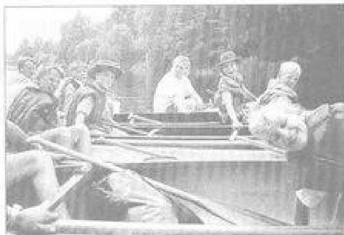
Ještě předtím naše posádka před vyjetím na Sázevu