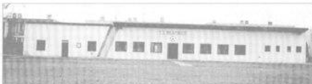
Kabiny na fotbalovém hřišti

K seriálu o historii blatnického fotbalu, uvedeného v minulých číslech Blatnického zpravodaje, přinášíme ještě tři fotografie z nočními minutami a současně.